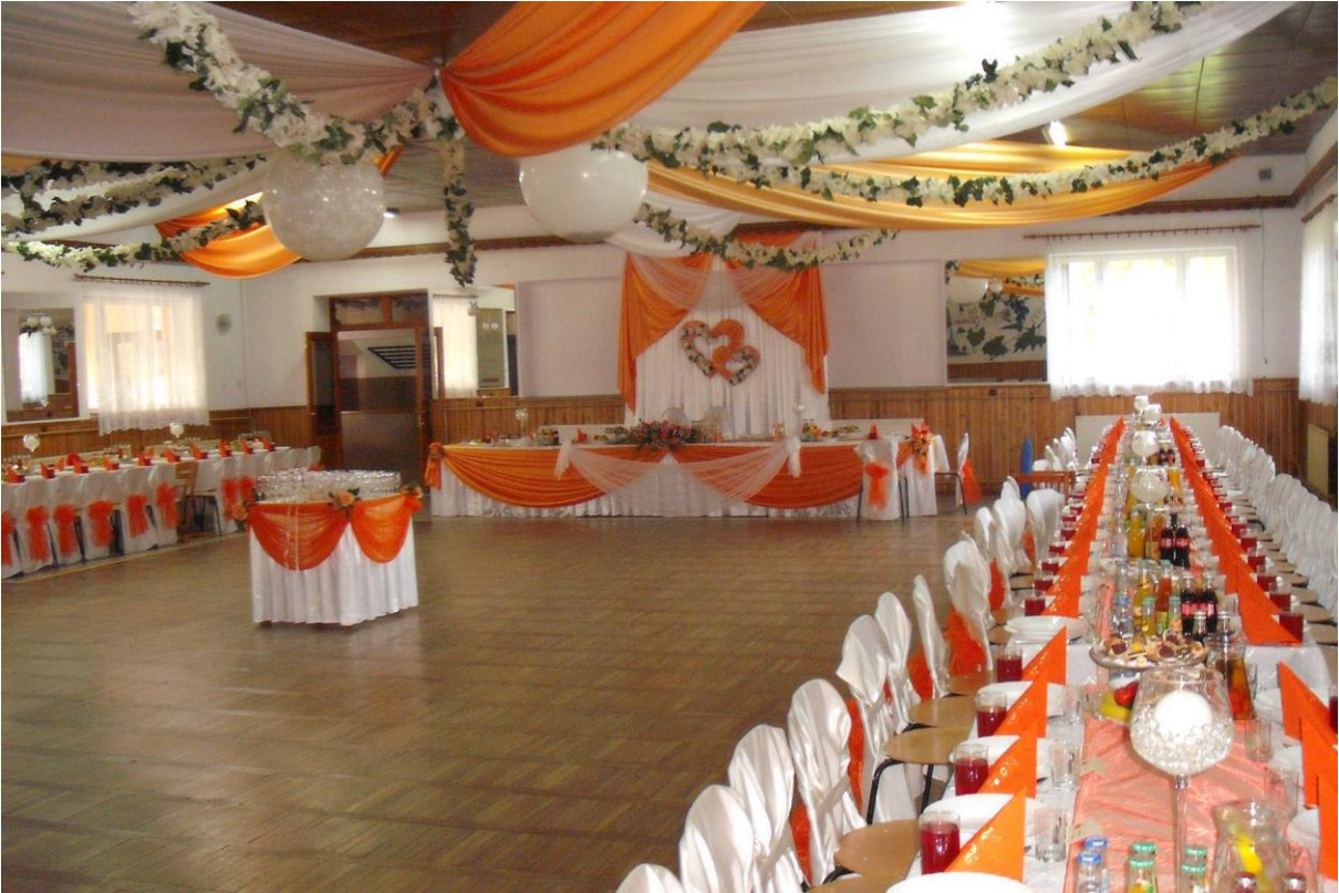
Klimatyzowana duża sala w OSP Kisielów (3)