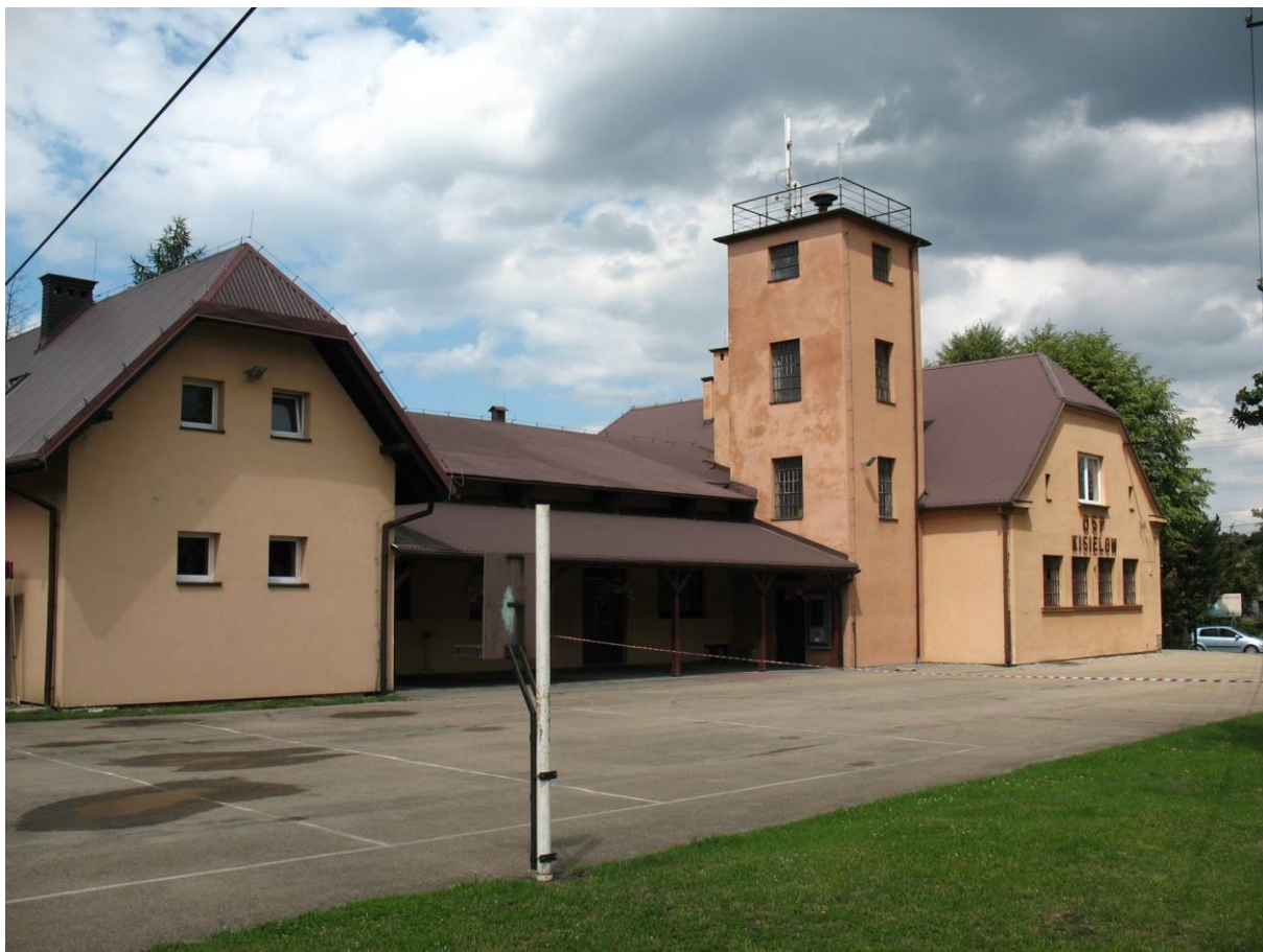
Budynek OSP Kisielów (3)