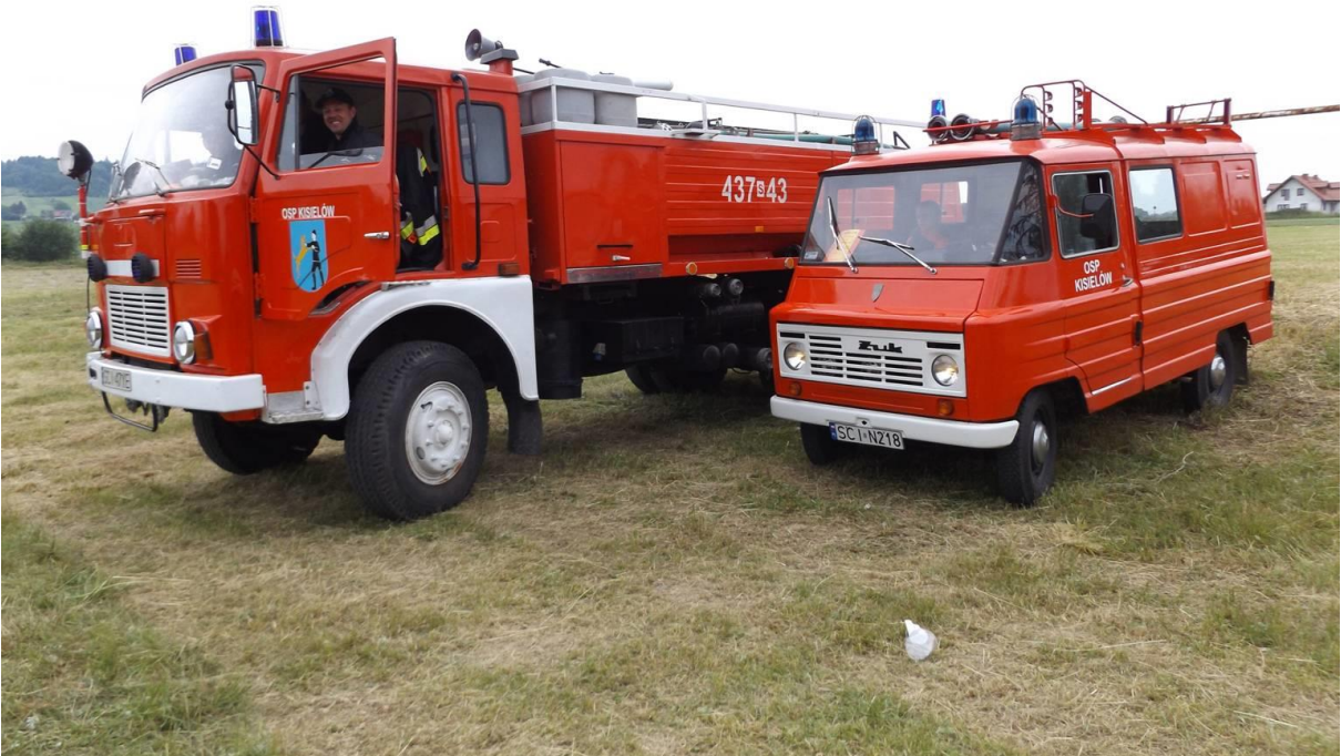
Wozy strażackie (3)