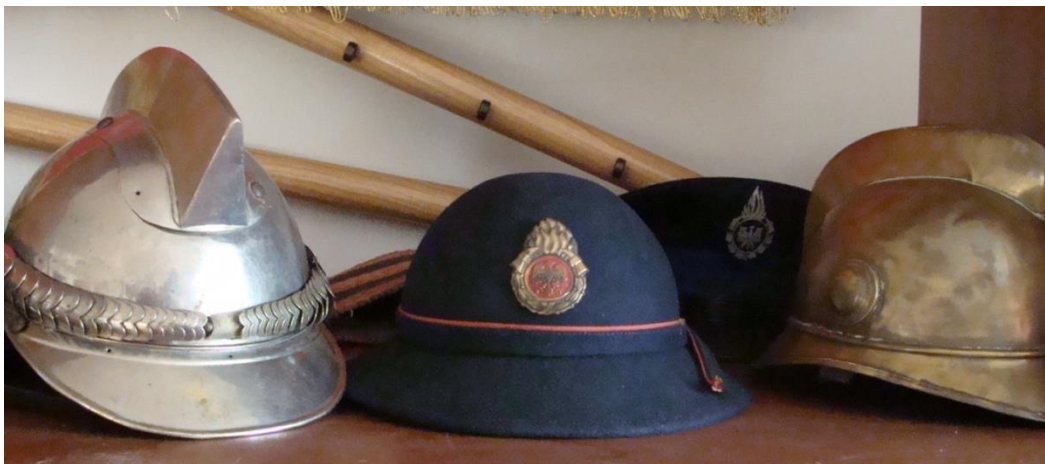
Hełmy strażackie ze zbiorów OSP Kisielów (2)