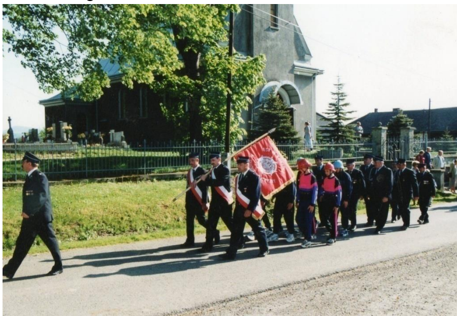
Przekazanie sztandaru jednostce z Kisielowa 02.05.1994 (1)