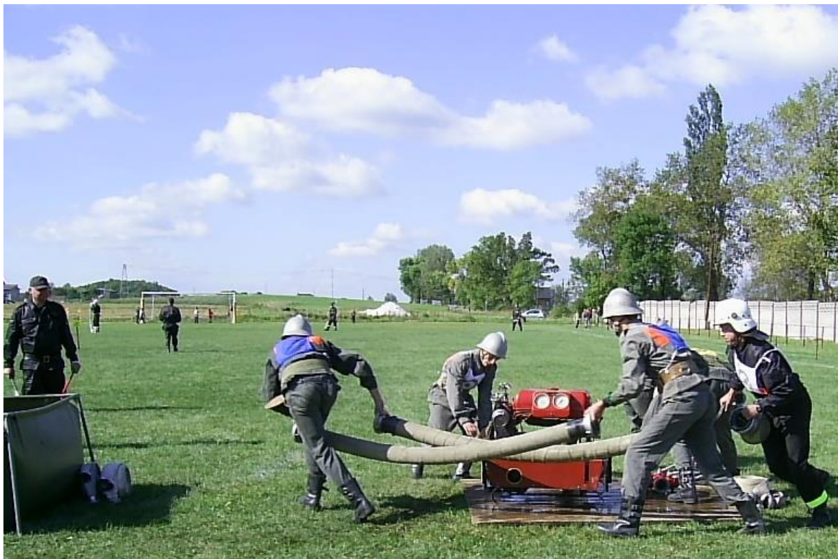
Zawody strażackie 13.09.2008 (1)