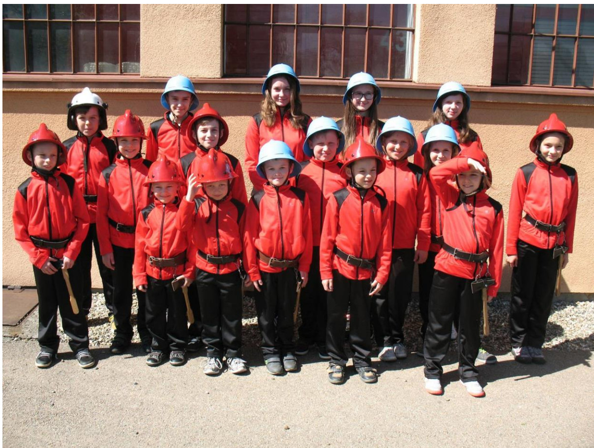
Reaktywowana w 2016 r. drużyna MDP w Kisielowie (3)

Przygotowanie komputerowe tekstu, zdjęć oraz korekta: Aleksandra Nowak