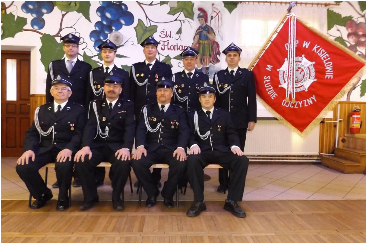
Obecny zarząd na lata 2016-2021 (3)