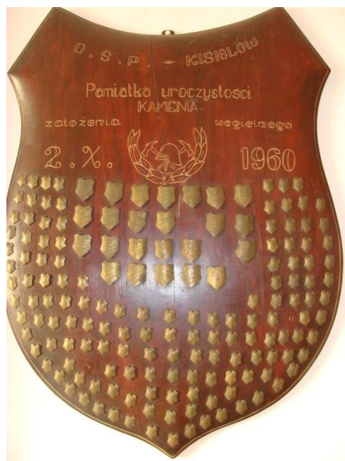
Pamiętka uroczystości wmurowania kamienia węglowego 2.10.1960 (2)