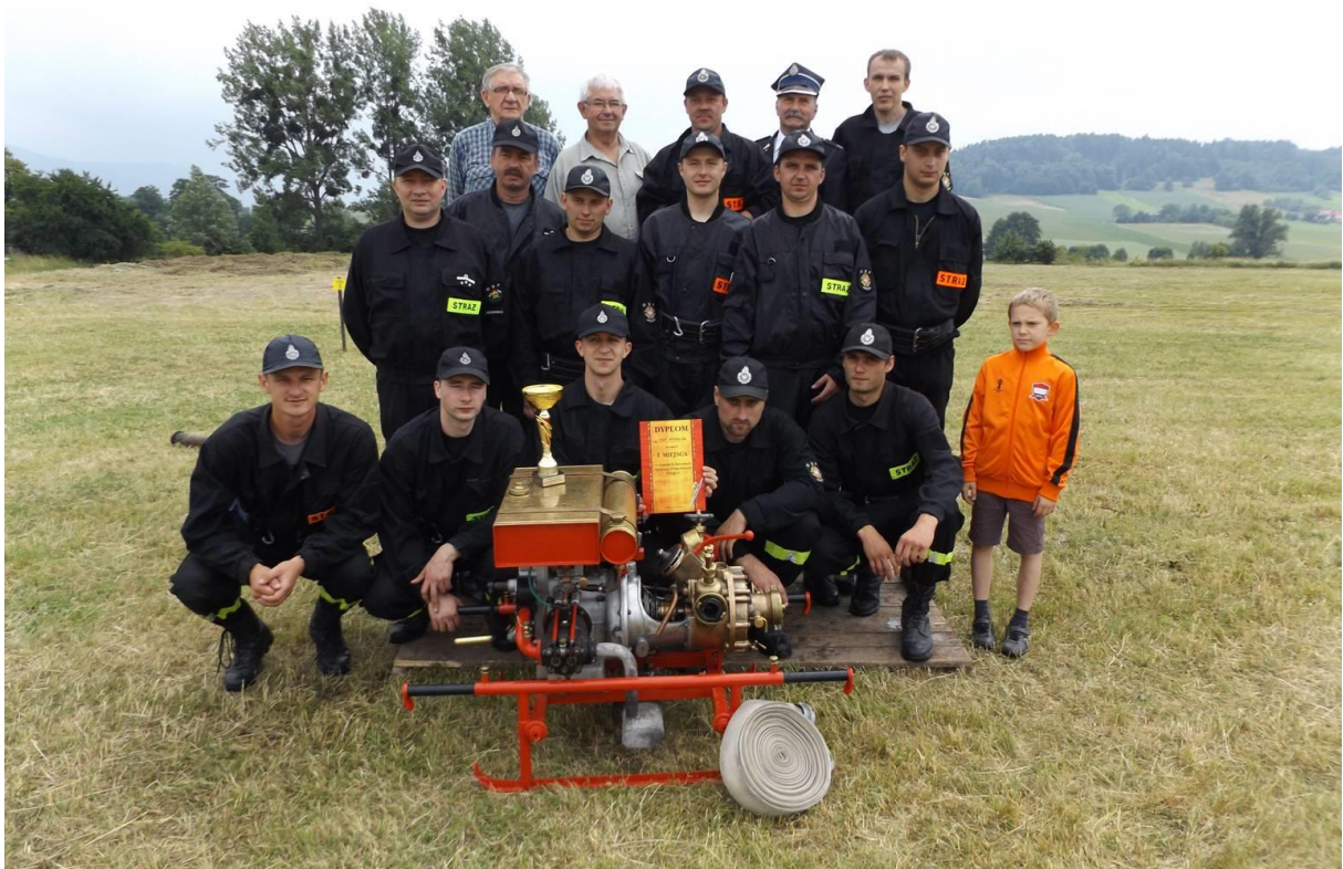
Gminne Zawody w Kisielowie w 2015 r. – zwycięska drużyna z Kisielowa (3)