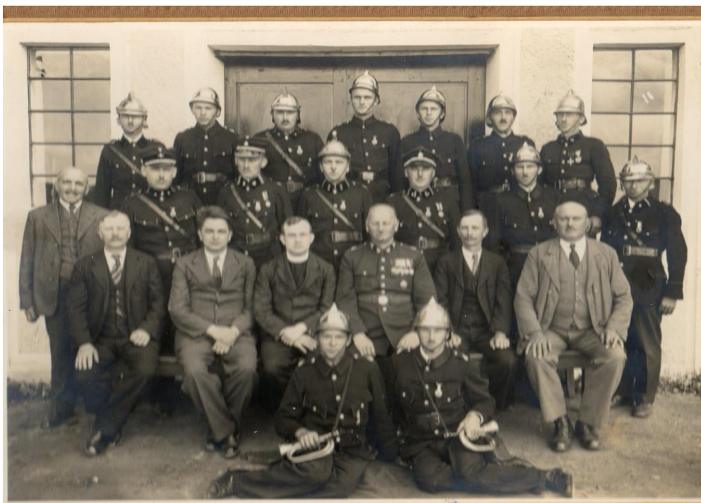
Zdjęcie zbiorowe strażaków 7.09.1939 r.