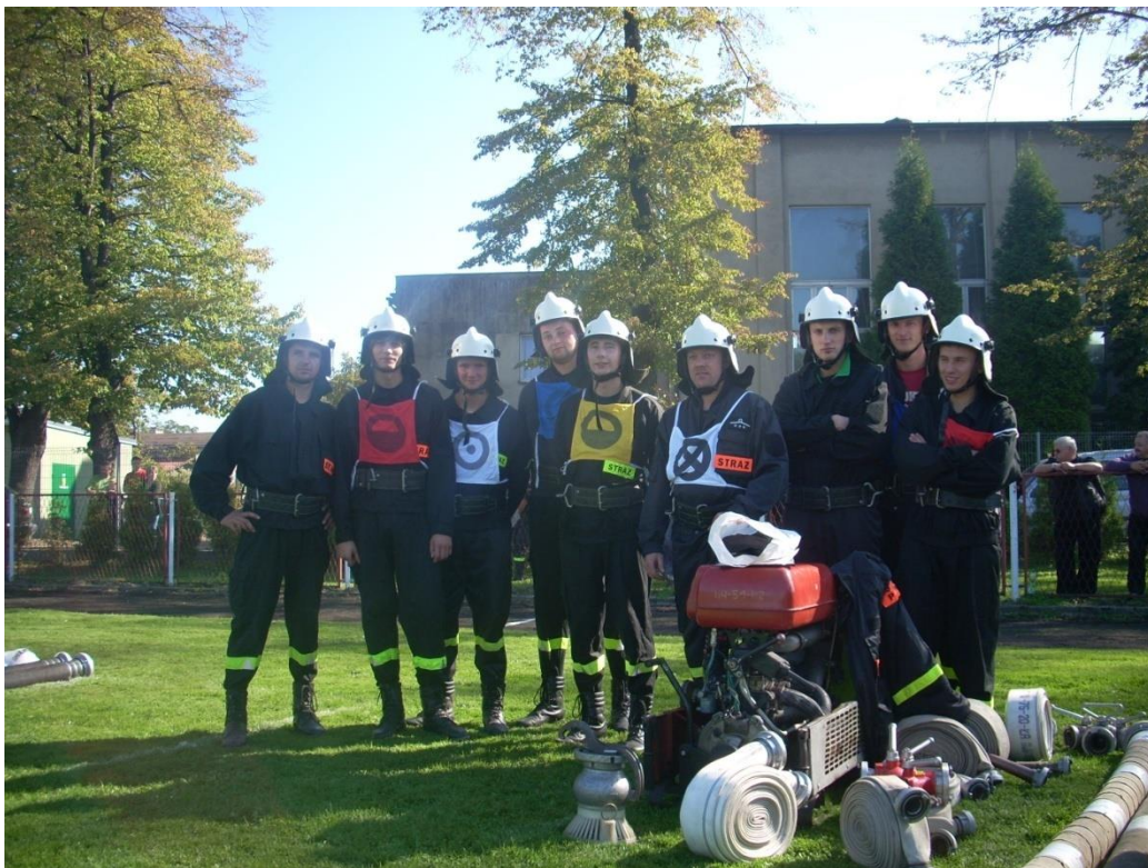
Zawody strażackie 01.10.2011 (1)