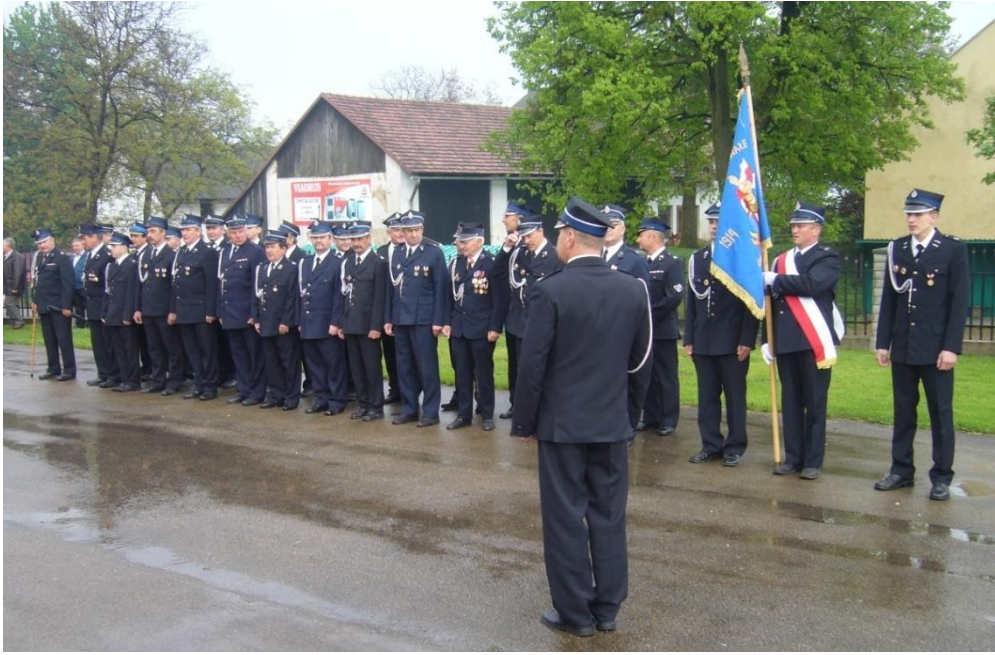
Uroczyste przekazanie samochodu Jelcz 14.12.2008 (1)