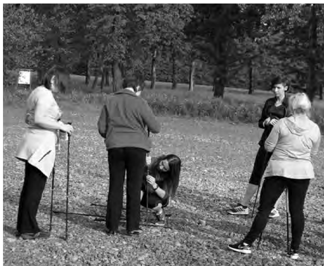
Regulacja kijów przed wyjściem w trasę