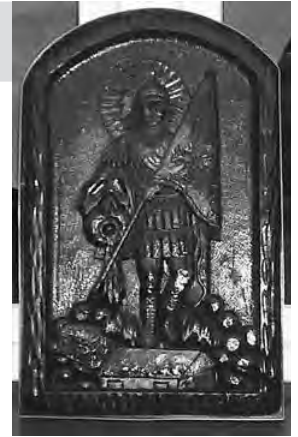
Płaskorzeźba św. Floriana

O kolejnych planach sołtysa zapewne dowiemy się z internetowej strony Godziszowa. Życzymy mu wiele zdrowia i wytrwałości w pełnieniu tej niełatwej służby na rzecz naszych mieszkańców i Gminy Goleszów.