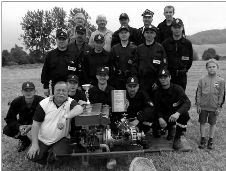
Zwycięska grupa z Kisielowa

W sobotę 27 czerwca br. na boisku piłkarskim w Kisielowie odbyły się Gminne Zawody Sportowo-Pożarnicze. W konkursie uczestniczyły kobiece, młodzieżowe oraz sołeckie drużyny strażaków z terenu gminy.