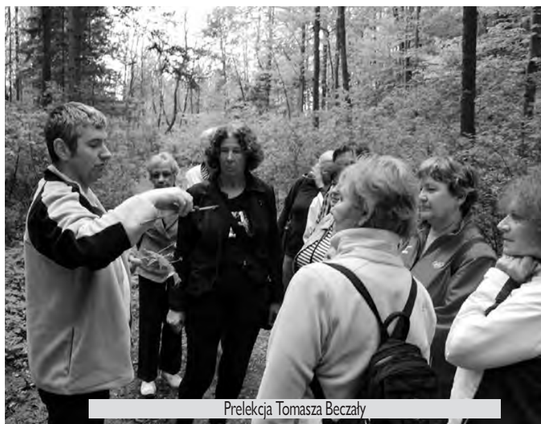
Prelekcja Tomasza Beczała