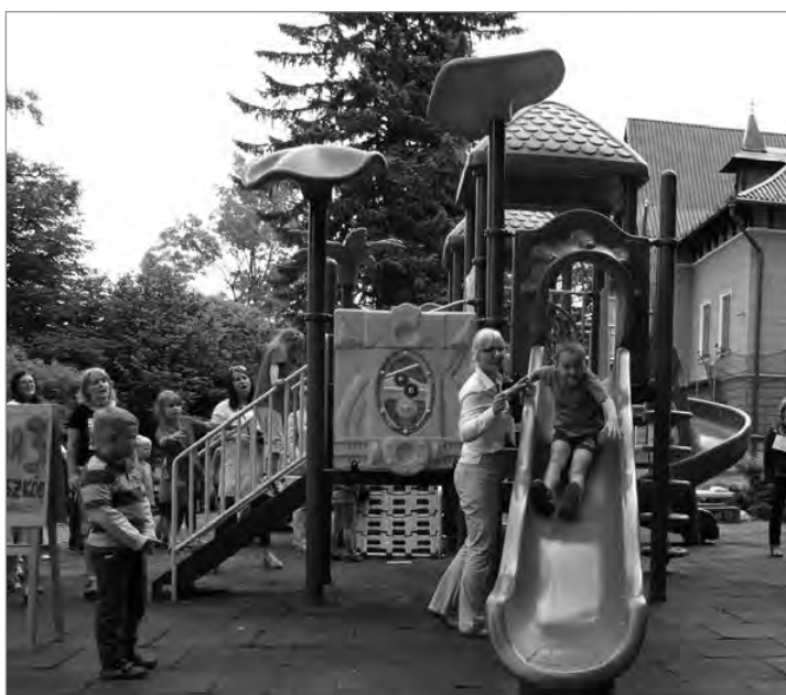
Zdjęcia przedszkolaków podczas konkurencji