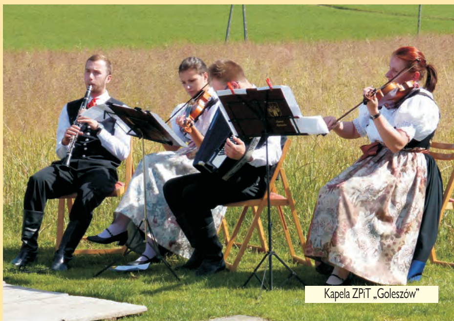
Kapela ZPiT „Goleszów”

Ale też to, co fórt nas lónczy, naszóm cieszyńskóm mowe.