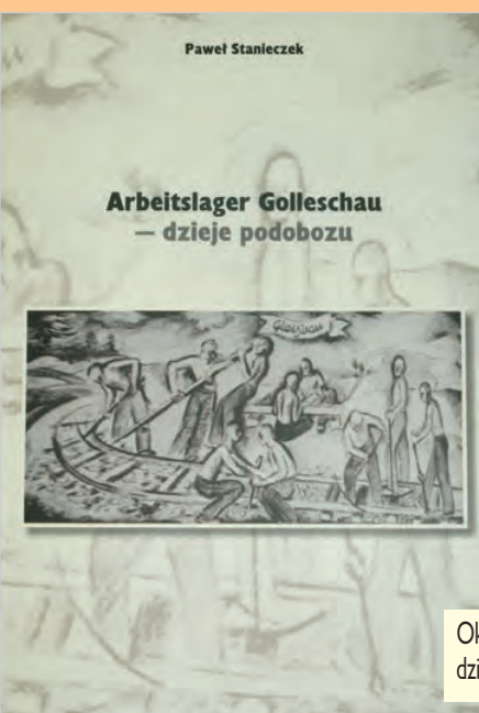
Okładka publikacji „Arbeitslager Gollerschau – dzieje podobozu” autorstwa Pawła Stanieczka