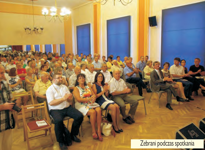
Zebrani podczas spotkania