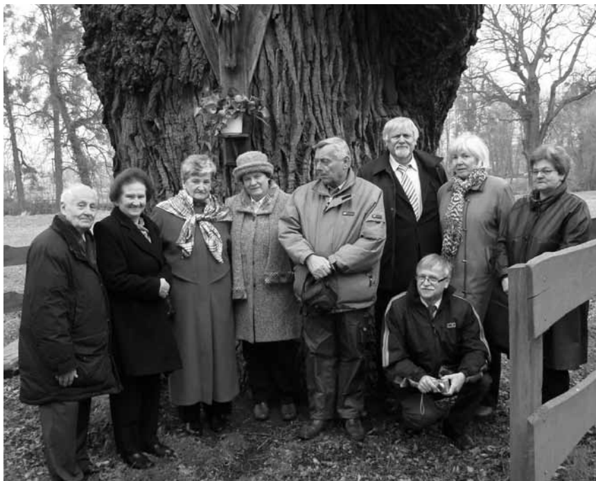
Grupa uczestników z Ziemi Cieszyńskiej biorących udział w kolędowaniu na zamku w Brzegu.