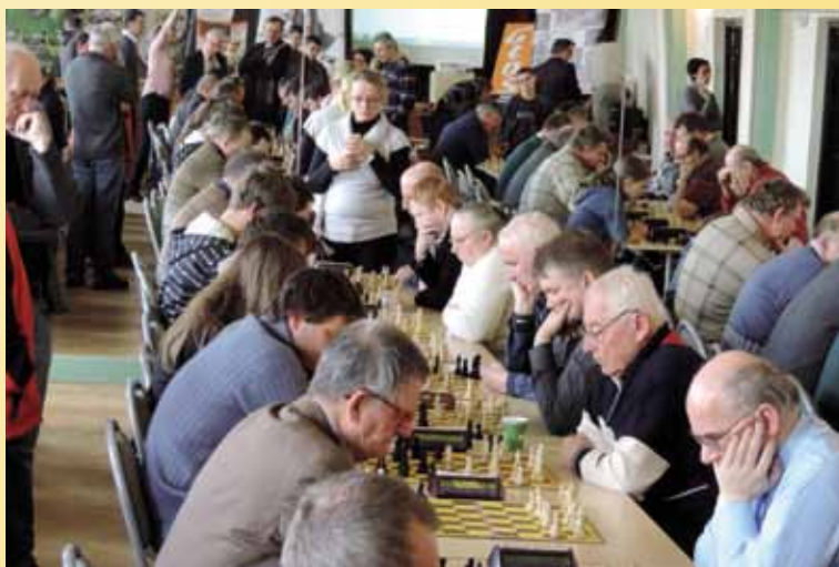
I turniej w ramach Grand Prix Gminy Goleiszów w Szachach 2014 rozegrano 1 lutego 2014 r.