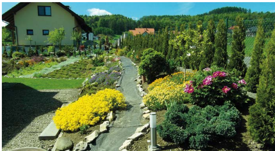
III miejsce – ogród Katarzyny Stasiewicz

Ze swojej strony, przy tej okazji, podziękowałam z wdzięcznością wszystkim zaangażowanym