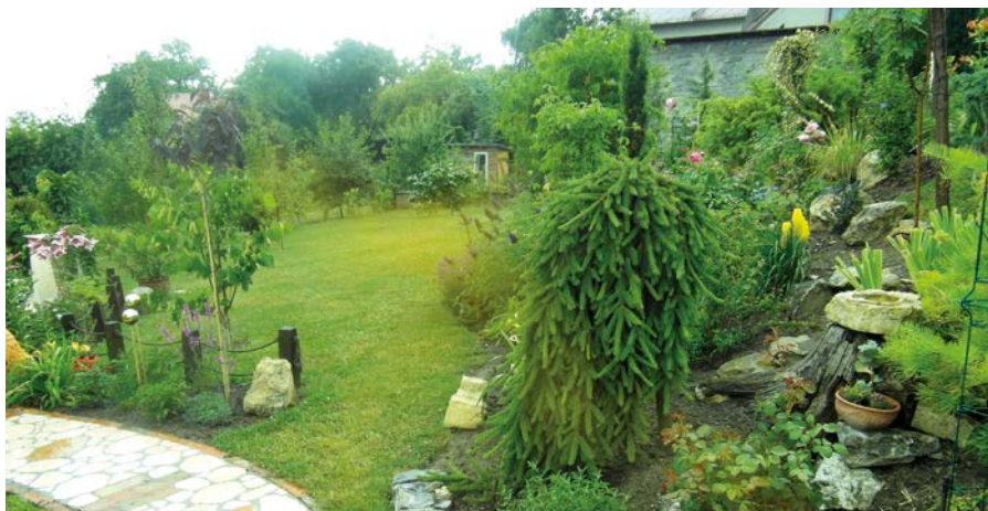
III miejsce – ogród Lidii Ziemiainin