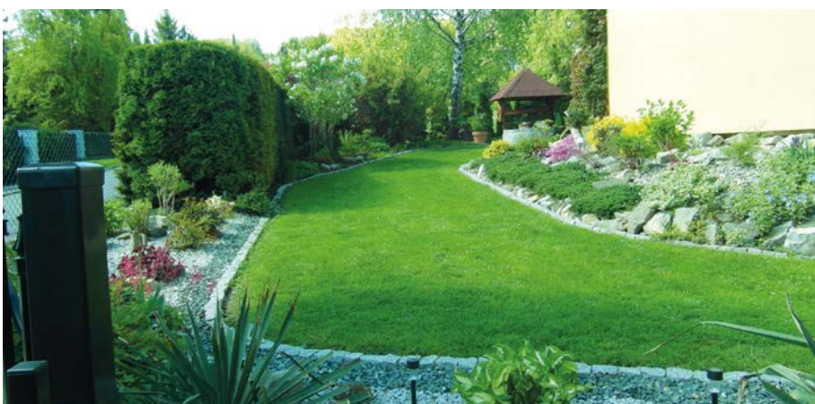
II miejsce – ogród Zofii Gibiec