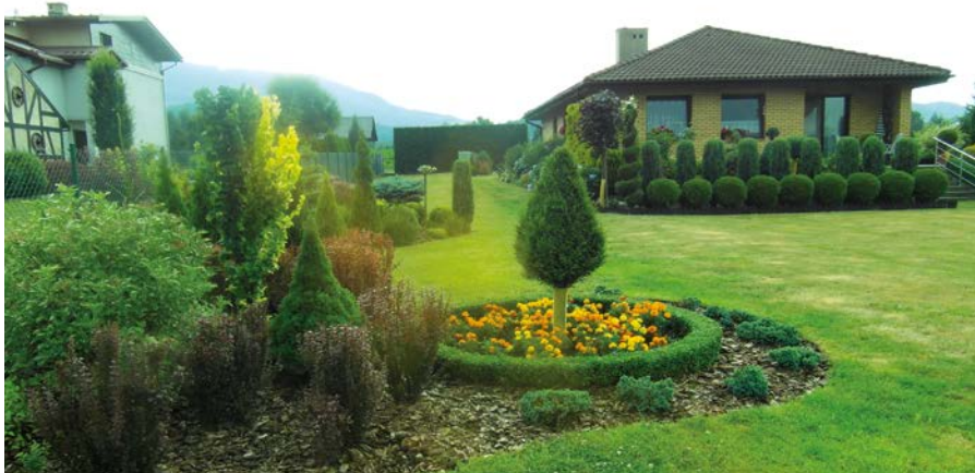
III miejsce – ogród Cecylii i Henryka Kościółków