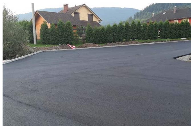
ul. Pawła Łyżbickiego

Zdaję sobie sprawę, iż mimo naszych starań nadal wiele podobnych dróg czeka na remont. Stale pracujemy nad pozyskaniem dodatkowych źródeł finansowania, które umożliwią przyspieszenie czasu oczekiwania na ich remont. W oczekiwaniu na kolejne konkursy i granty przygotowujemy kolejne projekty remontów i modernizacji, które są pierwszym krokiem do rozpoczęcia starań o zewnętrzne środki – komentuje Sylwia Cieślak – wójt naszej gminy. Redakcja