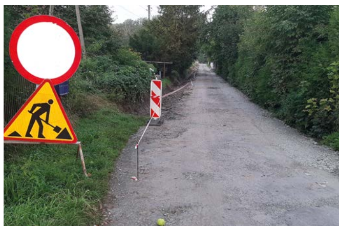
ul. Jana Ożany