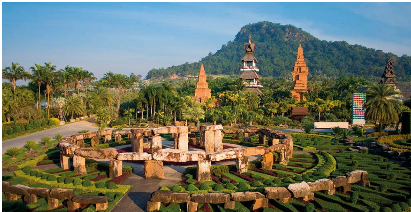
Fot. z archiwum A. Klimczaka