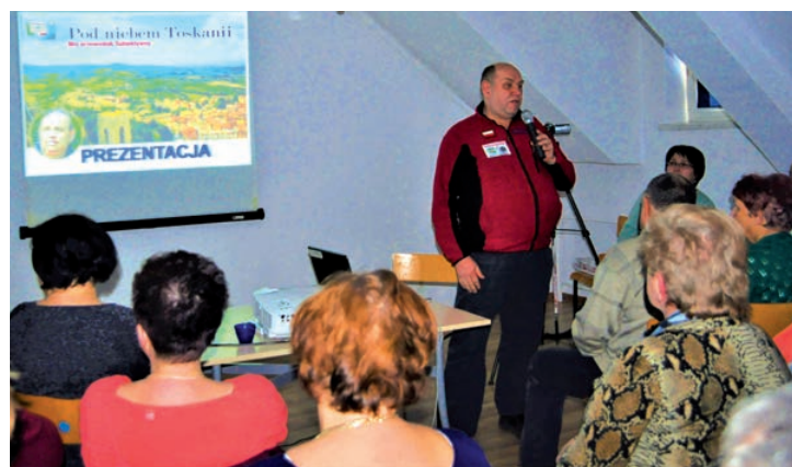
fol. z archiwum GOK-u