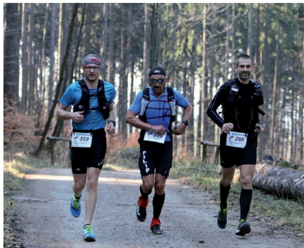
fot. A. Szczot, 2017, www.beskidzka160.pl