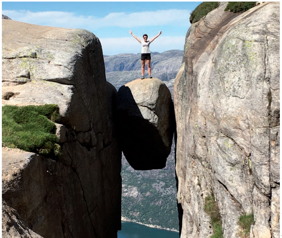
Autorka tekstu i Kjeragbolten

W następnym artykule zapraszam do pięknego Starego Miasta w Stavanger!