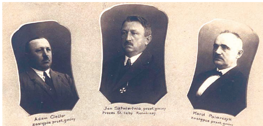
Fragment tablo Wydziału Gminnego w Goleszowie 1925 – 1929 na zakończenie kadencji i otwarcie ratusza, wykonanego przez zakład fotograficzny T. Kubisz M. Świąch z Cieszyna