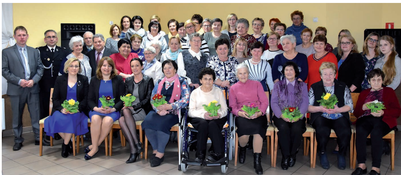
fol. K. Grzybek