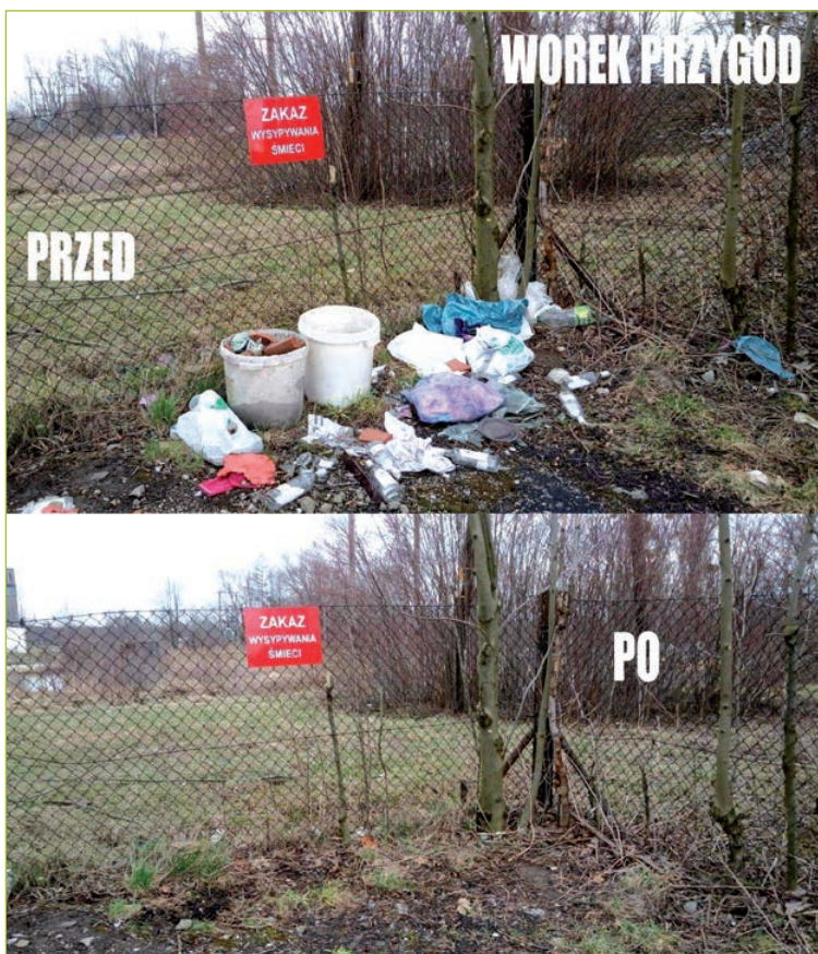
Jedno z posprzątaných miejsc

Towarzystwu Wędkarskiemu TON za udostępnienie miejsca na wspólne grillowanie po sprzątaniu.