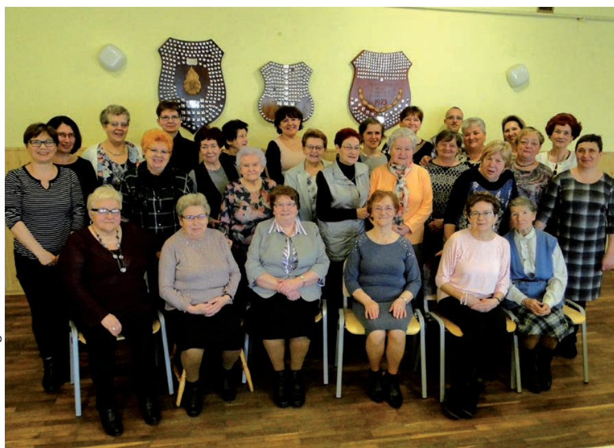
Uczestniczki Dnia Kobiet w Bażanowicach