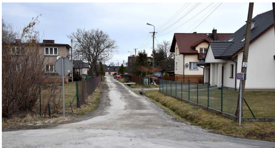
Wjazd na ul. Osiedlową, od ul. Ustrońskiej w Goleszowie Równi

Wykonawcą przebudowy drogi gminnej będzie firma Eurovia Polska S.A., wyłoniona w drodze postępowania przetargowego. Zakończenie robót budowlanych zaplanowano na koniec października 2019 r. Zadanie ubiega się o dofinansowanie ze środków EFRROW w ramach Programu