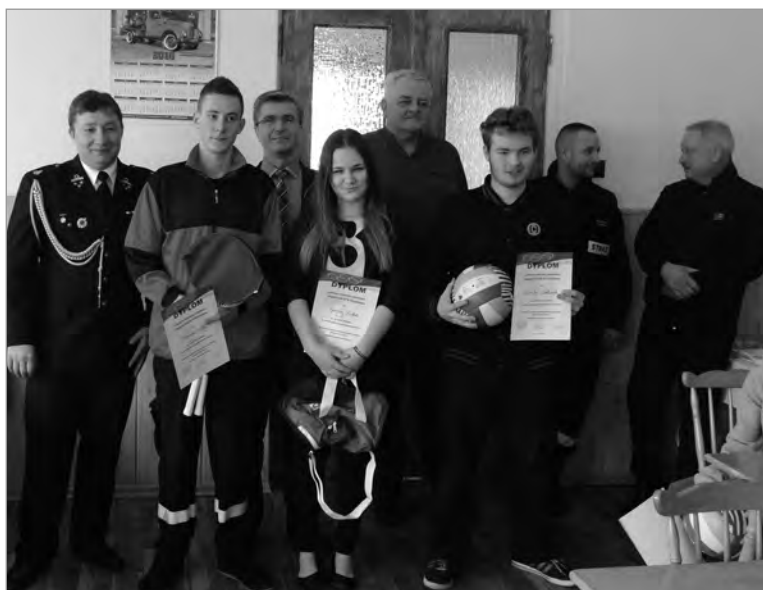
Najlepsi z najstarszej grupy wraz z organizatorami