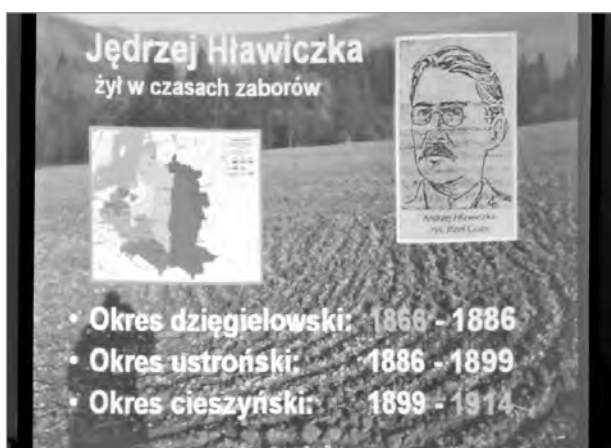
Część prelekcji multimedialnej

nych. W Cieszynie pracował w trzech szkołach i od 1911 r. jako profesor muzyki w Seminarium Nauczycielskim w Cieszynie Bobrku.