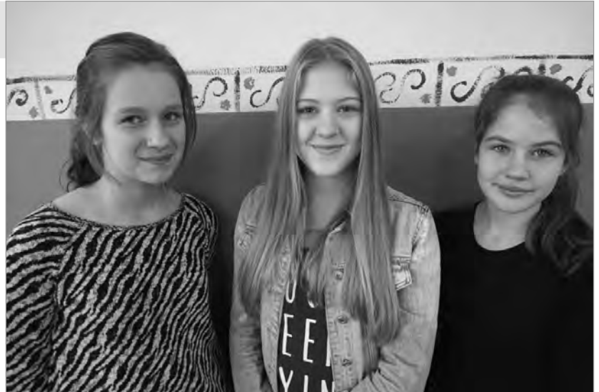
Uczennice reprezentujące gimnazjum w konkursach przedmiotowych - etap rejonowy

Kształtując młodego człowieka, należy spojrzeć na wiele aspektów jego życia. W naszym gimnazjum staramy się przygotować ofertę dla wszystkich. Dlatego mamy różnorodne zajęcia: sekcje sportowe, zespoły artystyczne, kółka przedmiotowe. Organizujemy wiele akcji, w których uczniowie mogą się realizować. Przygotowujemy paczki na Ukrainę, bierzemy czynny udział w WOŚP, opiekujemy się zwierzętami w schronisku, uczestniczymy w akcji Góra Grosza, odwiedzamy przed Świętami Bożego Narodzenia wychowanków domu dziecka, opiekujemy się pomnikiem pod Grabówką, wyjeżdżamy z uczniami klas 3. do muzeum Auschwitz – Birkenau, bierzemy udział w akcjach ekologicznych. Organizujemy wyjazdy do teatru i kina na spektakle oraz warsztaty teatralne, prowadzimy z uczniami ciekawe projekty na poszczególnych przedmiotach. Przy wsparciu finansowym GOPS-u organizujemy dla uczniów spektakle profilaktyczne, poruszające tematykę ryzykownych zachowań, niebezpieczeństw czyhających w internecie itp. Wyjeżdżamy na klasowe wycieczki, wyprawy