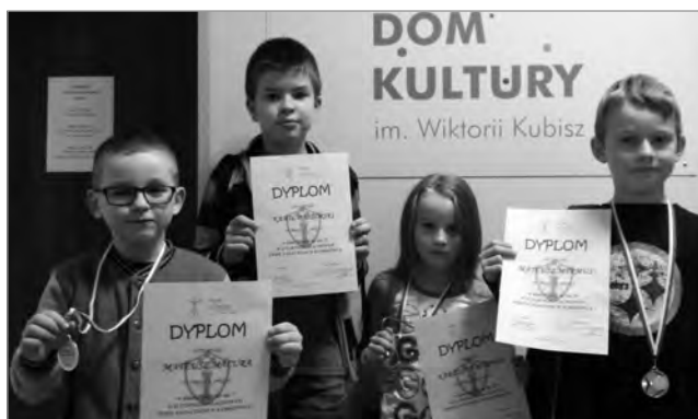
Marzenia się spełniają

W ostatni weekend lutego w Czerwionce-Leszczynach odbył się Turniej Szachowy dla Dzieci i Młodzieży „Ferie w Domu Kultury Leszczyny”. W turnieju wzięło udział pięciu zawodników Stowarzyszenia Szachowego