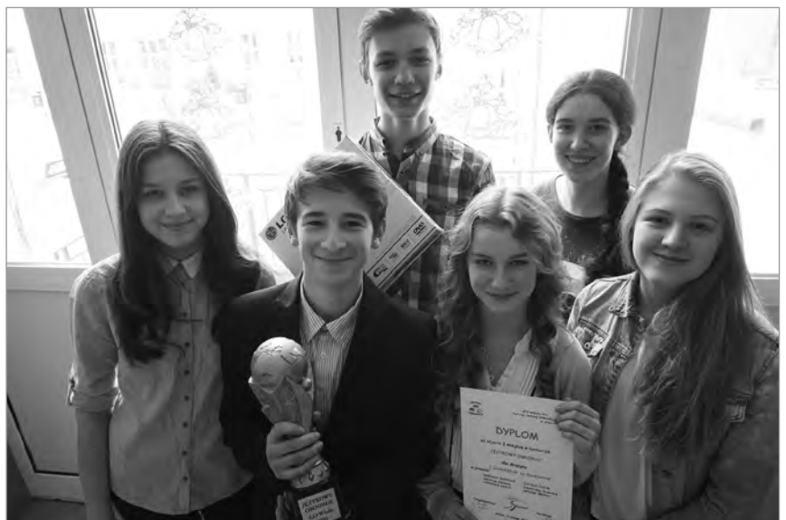
Drużyna biorąca udział w konkursie o tytuł Językowego Omnibusa 2016