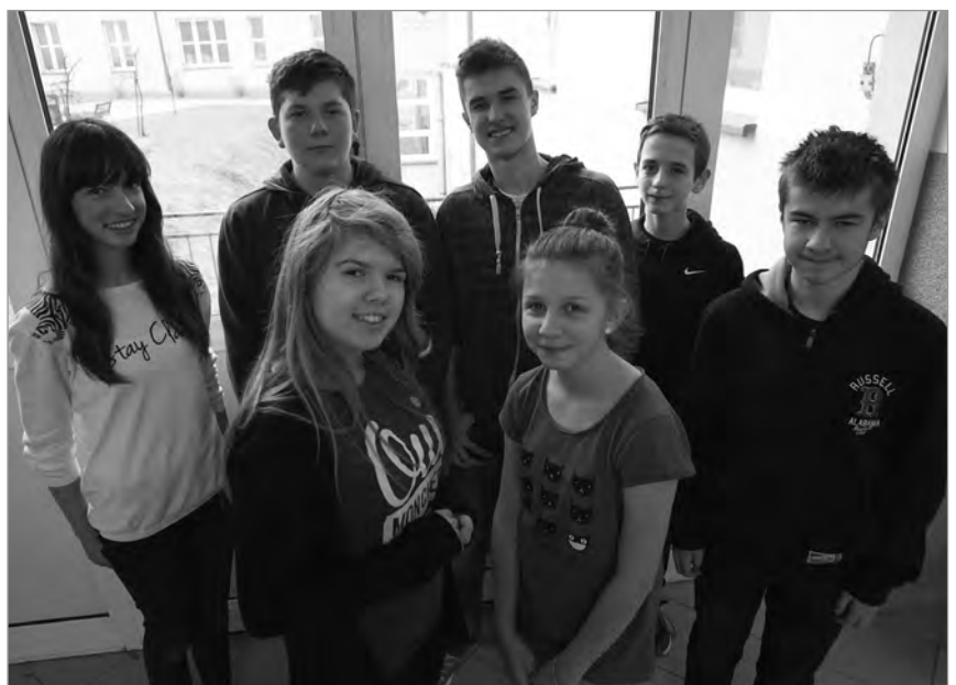
Uczniowie, którzy odnieśli sukcesy w konkursach wiedzy bibliijnej