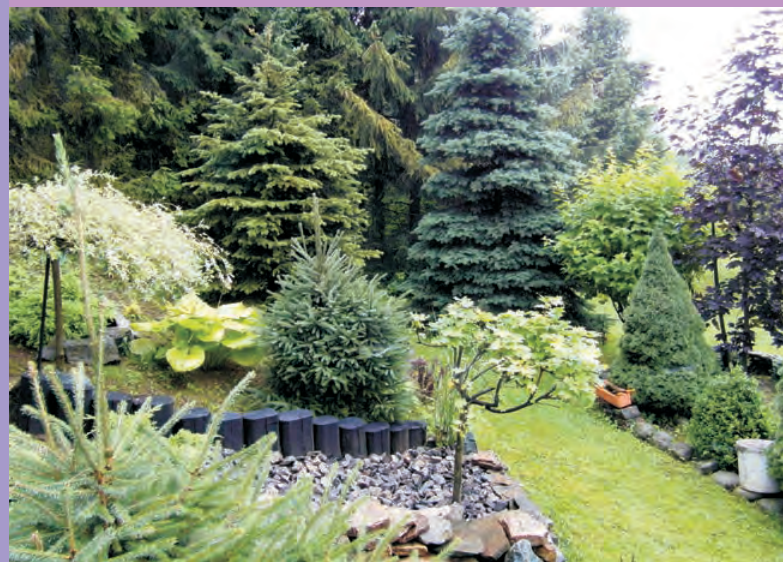
2 miejsce ex aequo Dziegielów