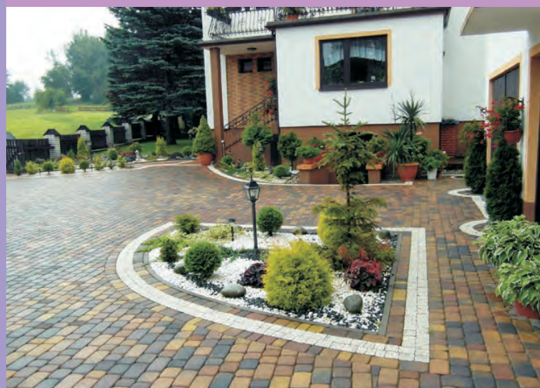
4 miejsce Dziegielów