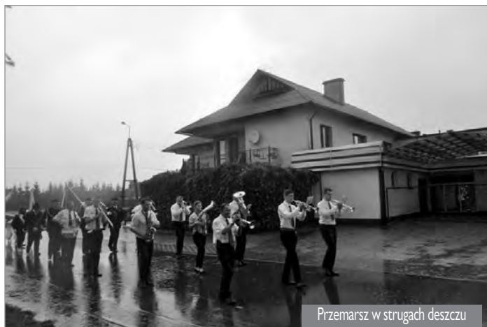
Przemarsz w strugach deszczu

Kolejny raz zostaliśmy bardzo serdecznie przyjęci, a nasza muzyka cieszyła się wielkim uznaniem tamtejszej publiczności.