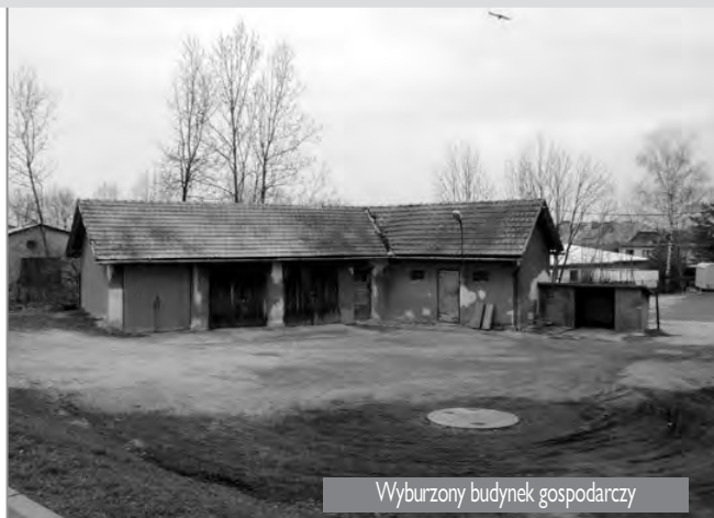
Wyburzony budynek gospodarczy