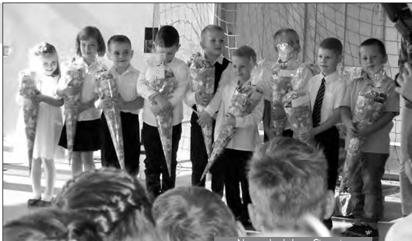
Nowy rok szkolny w Cisownicy