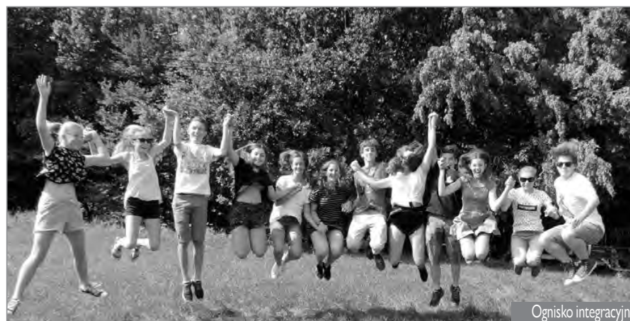
Ognisko integracyjne ZPiT „Goeszów”