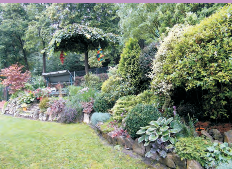
2 miejsce ex aequo Godziszów