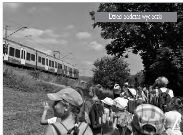
Dzieci podczas wycieczki

2 września 2016 r. Podczas tegorocznego „Pożegnania Lata z GOK-iem” wystąpił bielski zespół „Riffertone”, który jest laureatem przeglądu muzycznego „Zrób głośniejszy” i finalistą eliminacji „Przystanku Woodstock”. Członkowie zespołu współpracują w projektach muzycznych ze znanymi muzykami polskiej sceny takimi jak: Natalia Kukulska, Ania Dąbrowska i Kuba Badach. Gwiazdą tego wieczoru był zespół „ŁZY”, który gra na polskiej scenie rockowej od 20 lat. Mają na koncie ponad tysiąc zagranych koncertów w kraju i za granicą, szereg nagród i wyróżnień, m.in. 3 Płatynowe i 4 Złote Płyty, Nagrody Publiczności na festiwalu w Opolu, czy dwie Superjedynki. Pod sceną i wokół