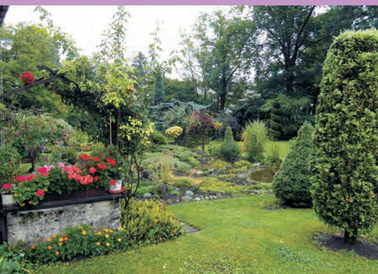
5 miejsce Goleiszów Dolny