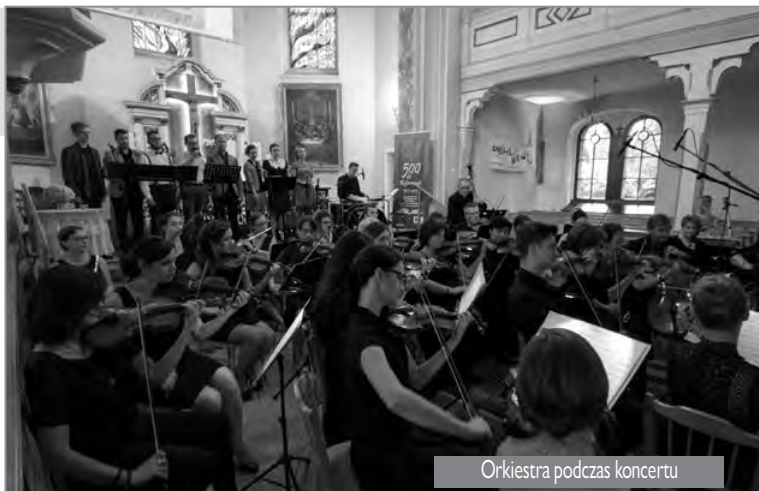
Orkiestra podczas koncertu

Nasze podziękowania kierujemy również w stronę licznie przybyłej publiczności.