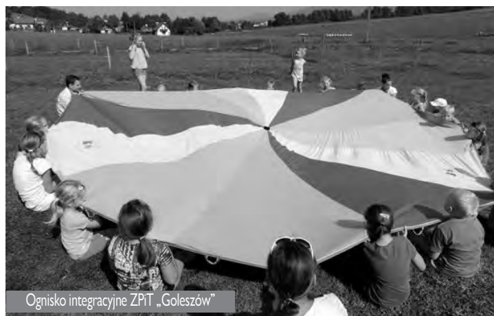
Ognisko integracyjne ZPiT „Goeszów”