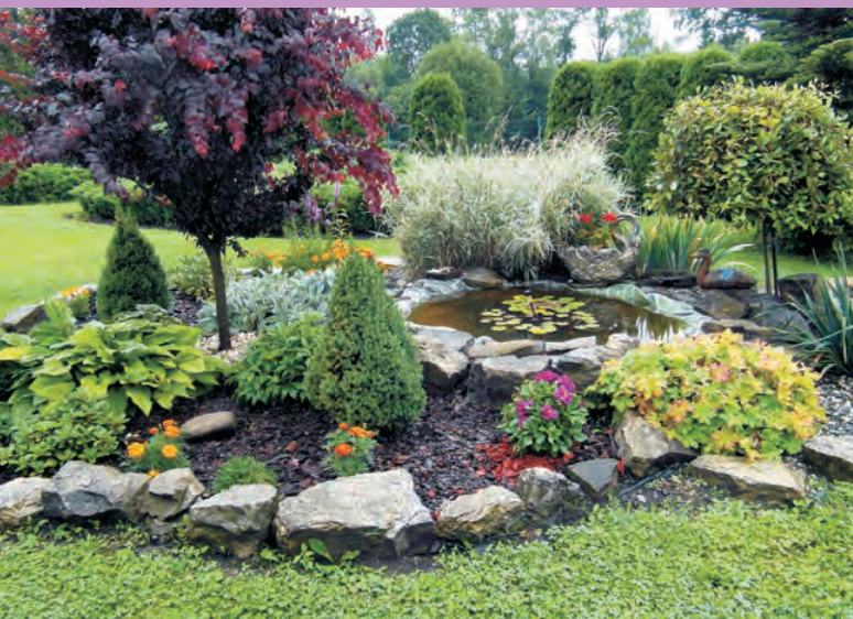
1 miejsce Puńców