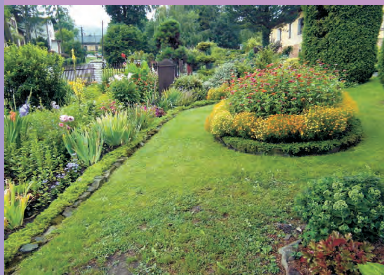
6 miejsce Goleiszów Dolny