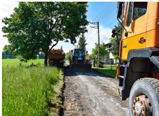
Dziegielów, ul. Miodowa.