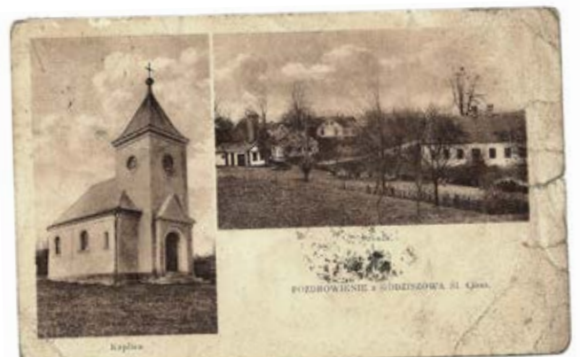
Godziszów, 1934 r., Kaplica i szkoła.