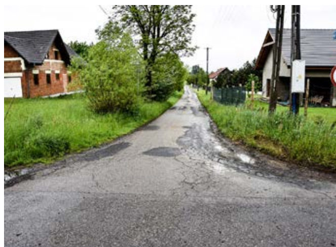
Kisielów, ul. Wspólna.