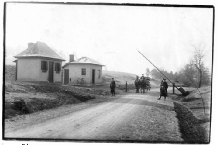
Leszna Górna, 1930 r., przejście graniczne.