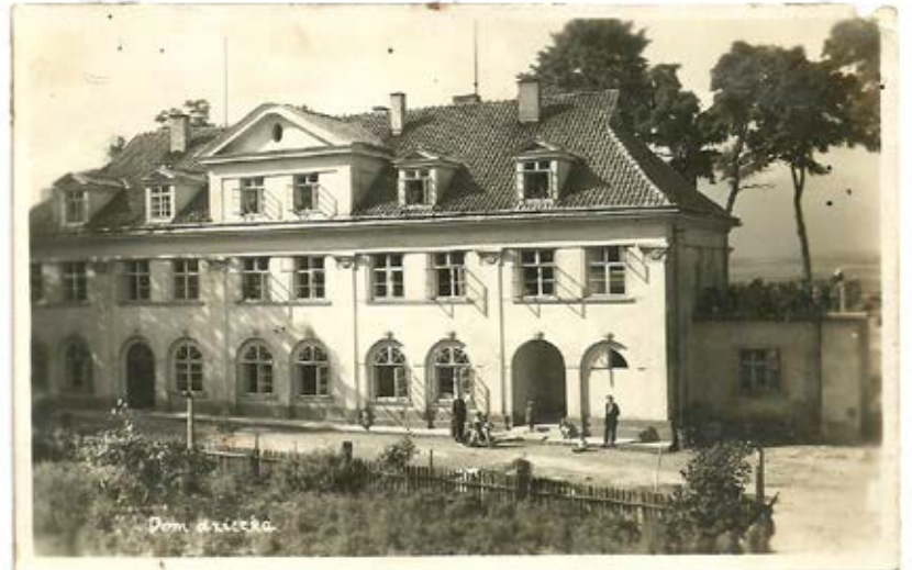
Dziegiełłów, 1927 r., Dom dziecka.