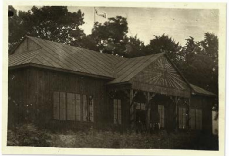
Dziegiełłów, 1927 r., kościół Ewangelicko-Augsburski.