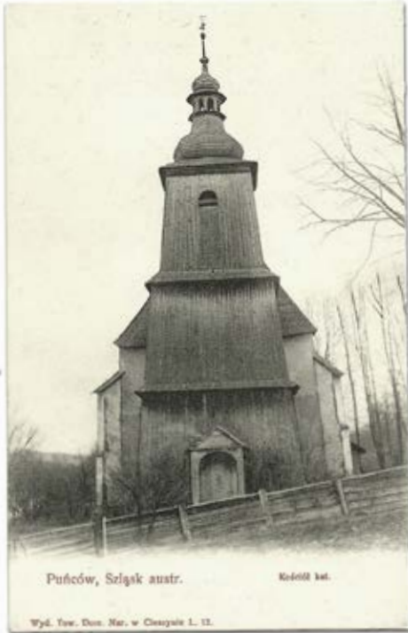
Puńców, 1903 r., kościół katolicki.