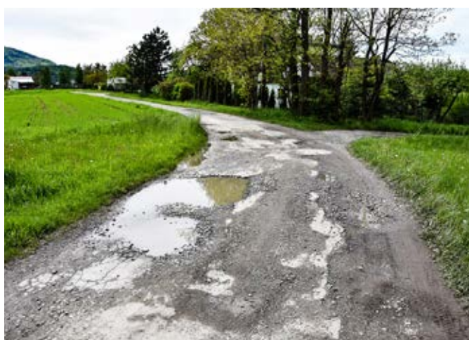
Goleiszów Równia, ul. Orzechowa.