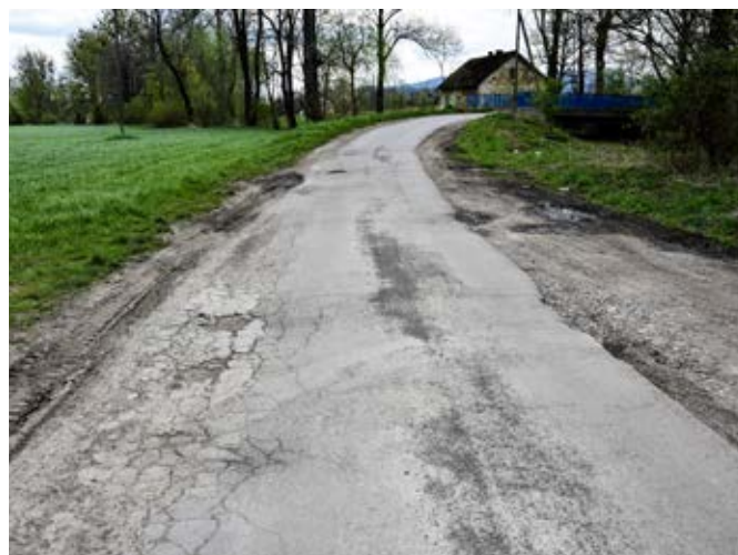
Godziszów, ul. Nierodzimska.

ul. Rolnicza w Puńcowie oraz ul. Polna w Kozakowicach Górnych, jednak z uwagi na ograniczoną liczbę dostępnych środków przeznaczonych do podziału, na ten moment znalazły się one na liście rezerwowej.