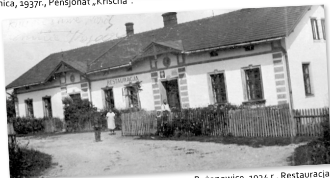
Bażanowice, 1934 r., Restauracja.