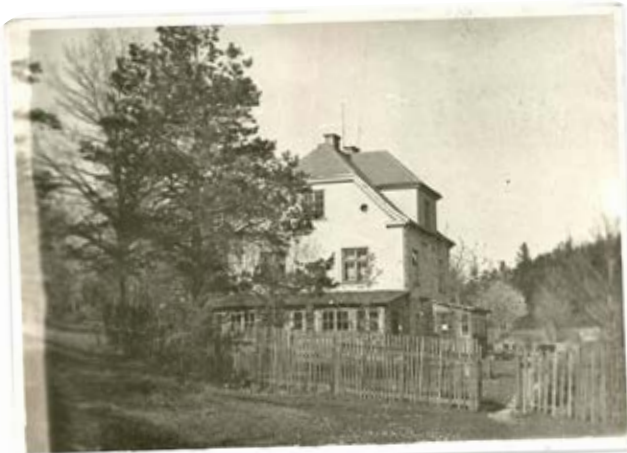
Cisownica, 1937r., Pensjonat „Krischa”.