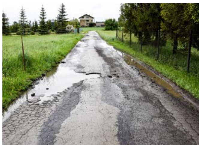
Kisielów, ul. Wspólna.