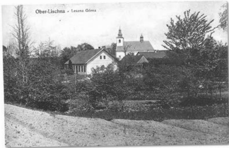
Leszna Górna, 1914 r., kościół.