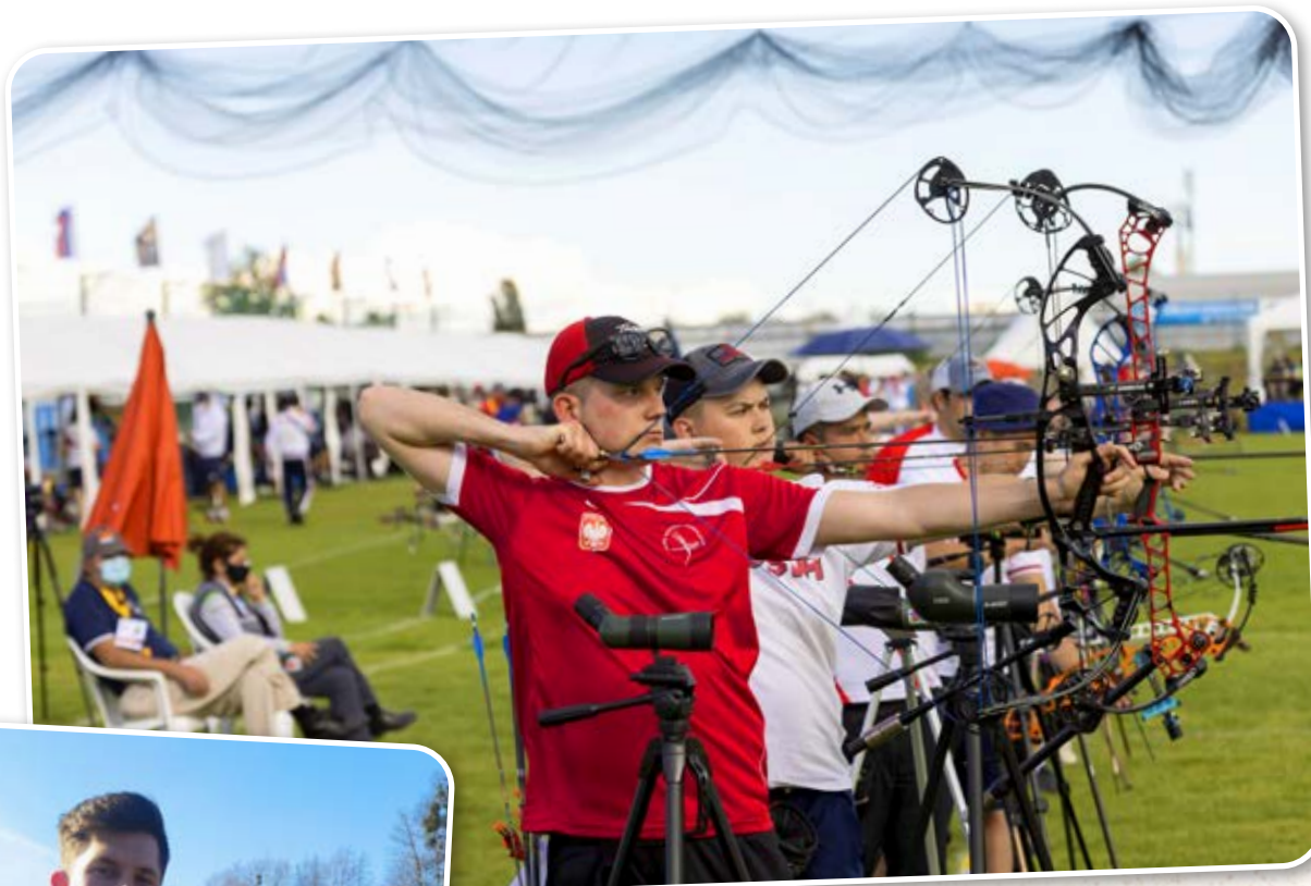
Puchar Europy Juniorów w Catez.

Bycie w reprezentacji mogę nazwać wejściem na kolejny poziom sportowy. Zgrupowania z trenerami kadry, zawody kontrolne i wyjazdy na zawody międzynarodowe, to wszystko pozwala rozwinąć skrzydła, jednakże wiąże się z byciem cały czas w gotowości. Ciągły rozwój i rywalizacja na najwyższym poziomie wymaga dziesiątek tysięcy strzałów rocznie, treningów 5-6 razy w tygodniu, których intensywność i regularność kontrolują trenerzy Kadry. Duża ilość wyjazdów wymaga dużej determinacji i dobrego planowania, by nie mieć zbyt wielu zaległości w szkole, jednakże wszystko da się zorganizować.