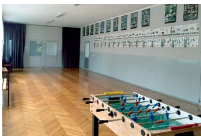
Szkoła podstawowa w Bażanowicach.

Zmiany nastąpiły także w Szkole Podstawowej w Bażanowicach, gdzie na nowe wymieniono drzwi w 5 pomieszczeniach szkolnych, jak również przeprowadzono remont holu w budynku szkoły. Prace remontowe polegały m.in. położeniu nowych gładzi gipsowych, uzupełnianiu tynków, jak również odmalowaniu holu, co z pewnością zostanie zauważone przez przekraczających progi bażanowickiej podstawówki.