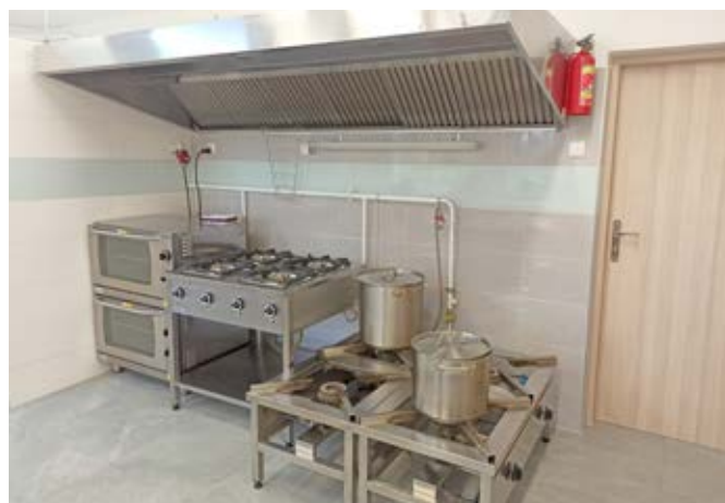
Kuchnia Zespołu Szkolno-Przedszkolnego w Dzięgielowie.

„Posiłek w szkole i w domu”. Wsparcie finansowe wykorzystano na usługi remontowe oraz zakup wyposażenia bloku żywieniowego. Prace obejmowały m. in. gruntowny remont ścian i podłóg, modernizację instalacji