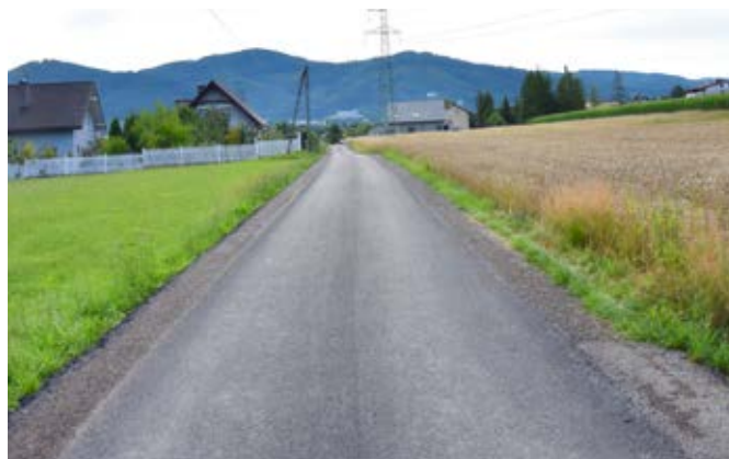
Goleiszów Równia, ul. Orzechowa.