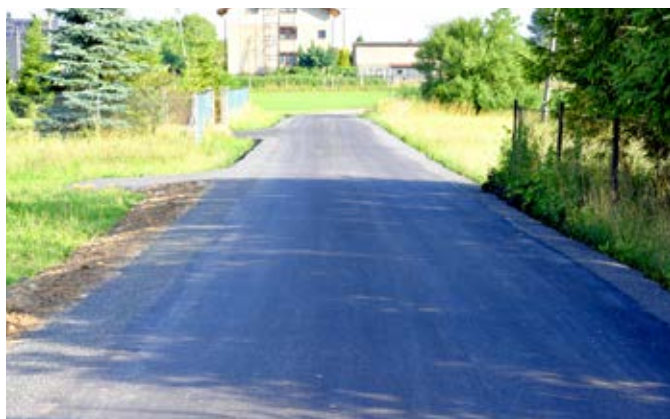
Kisielów, ul. Wspólna.

Gminne inwestycje drogowe realizowane są obecnie na ul. Szerokiej w Goleiszowie, ul. Leśnej w Puńcowie, ul. Spacerowej w Bażanowicach, ul. Objazdowej w Bażanowicach oraz ul. Pogodnej w Cisownicy. Oprócz nich stale wykonywane są bieżące naprawy gminnych dróg polegające na cząstkowych naprawach mniej uszkodzonych nawierzchni, dla których rozwiązaniem może być wypełnienie spękań z wykorzystaniem narzędzi i materiałów zakupionych w tym celu na potrzeby referatu drogowego Urzędu Gminy w Goleiszowie.