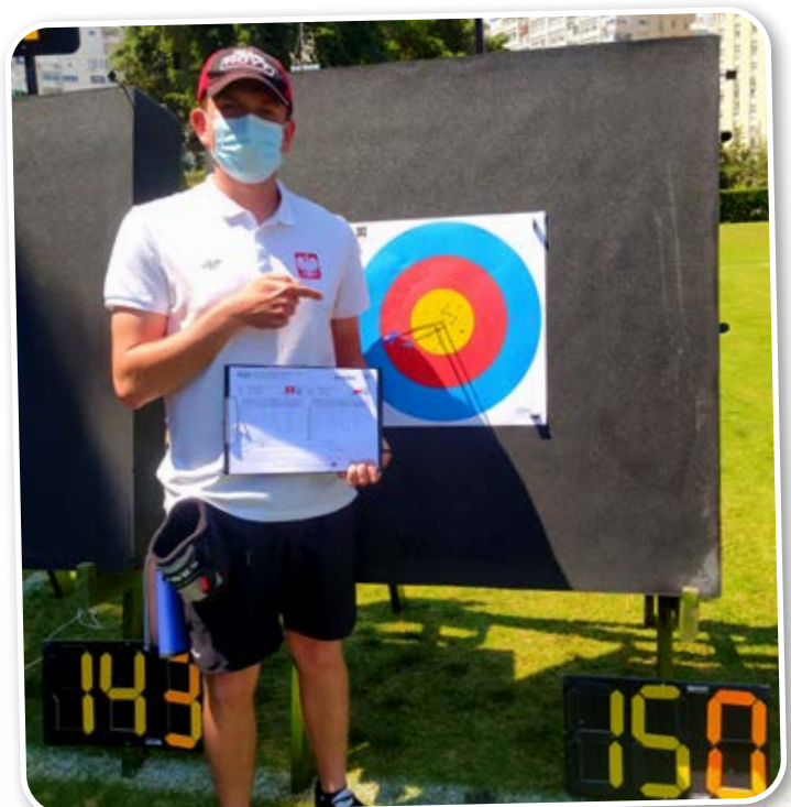
Rekord Polski w Antalii.

Do moich największych osiągnięć mogę zaliczyć brązowy medal Pucharu Europy Juniorów, rekord Polski Seniorów 150/150 punktów, 6. miejsce na Grand Prix Europy Seniorów, 1. miejsce w turnieju Berlin Open, Halowe Wicemistrzostwo Polski Seniorów i wiele innych krajowych medali, jak i pucharów.