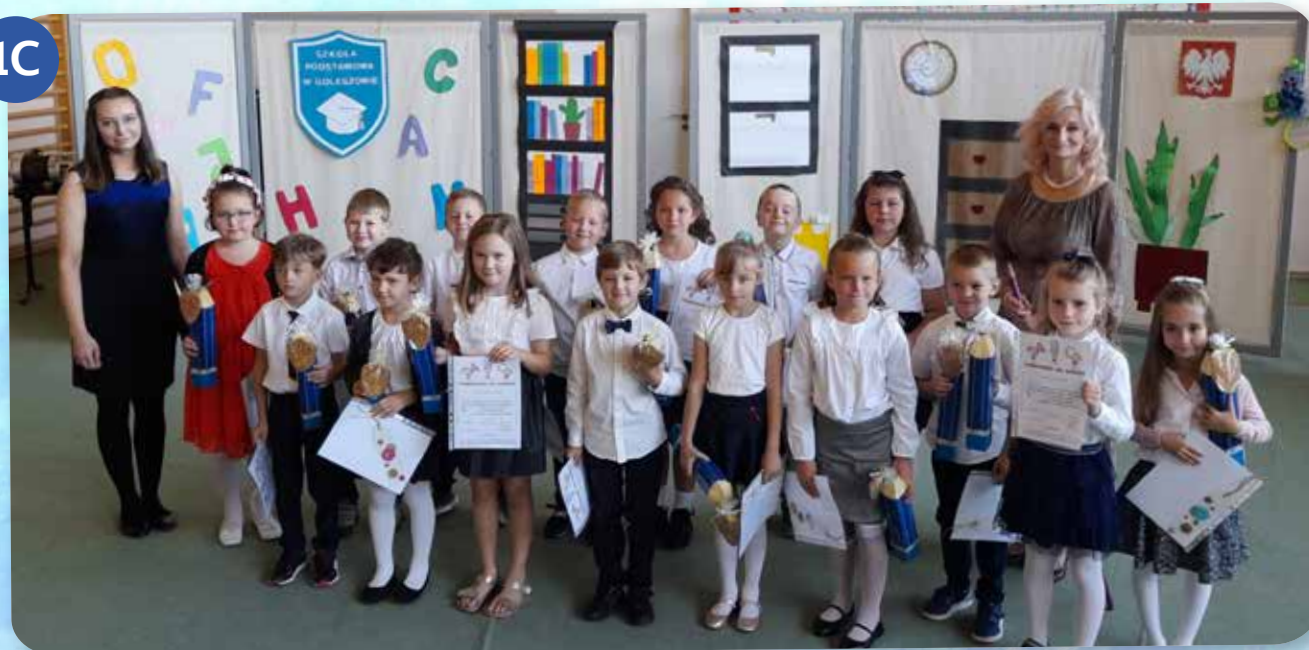
SP z Bażanowic