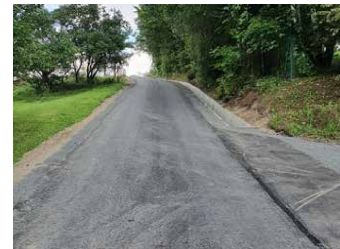
Leszna Górna, ul. Spacerowa