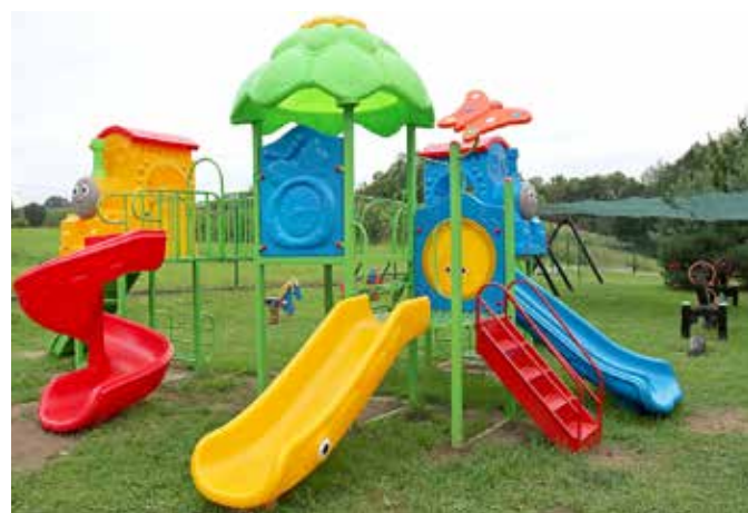
Plac zabaw w Puńcowie

manii dofinansowania z rządowego programu „Posiłek w szkole i domu” na lata 2019–2023 (moduł 3). Prace remontowe w szkole objęły też modernizację kilku sal lekcyjnych i innych pomieszczeń.