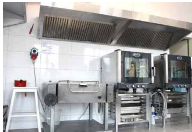
Wyremontowana kuchnia w SP Goeszów

W Szkole Podstawowej w Goeszowie przeprowadzono remont generalny kuchni. Dodatkowo zamontowano nowoczesne wyposażenie, m.in. piec konwekcyjno-parowy i piec elektryczny, zmywarkę kapturową i meble kuchenne. Realizacja projektu była możliwa dzięki otrzy-