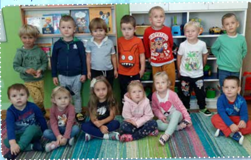
„Supermaluszki” z Bażanowic