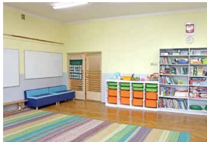
Przedszkole w Bażanowicach