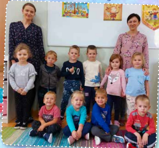
„Biedronki” z Cisownicy