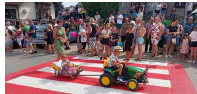
Fotorelacja na s. 46-48

Tradycyjnie w ostatni wakacyjny weekend odbyły się Dożynki Gminne – Dni Gminy Goleszów. Był to czas obfitujący w niezwykle atrakcje. W dwudniowym święcie wzięło udział kilka tysięcy osób. Całość rozpoczęła się w sobotę 27 sierpnia barwnym korowodem dożynkowym, który przeszedł ulicami Goleszowa i zgromadził wielu widzów. Wśród uczestników znaleźli się przedstawiciele wszystkich sołectw, prezentujący m.in. sprzęt rolniczy i scenki rodzajowe, samorządowcy naszej gminy oraz zaproszeni goście.