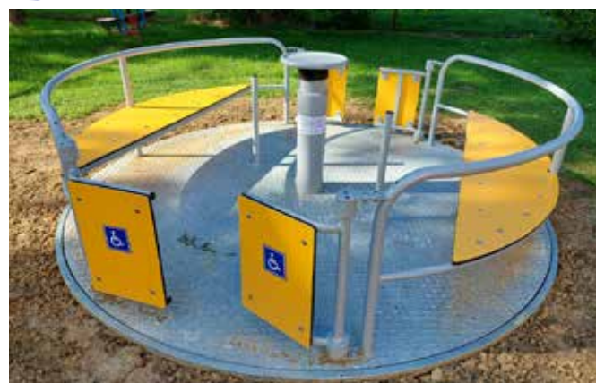
Karuzela integracyjna w dziegielowskim przedszkolu