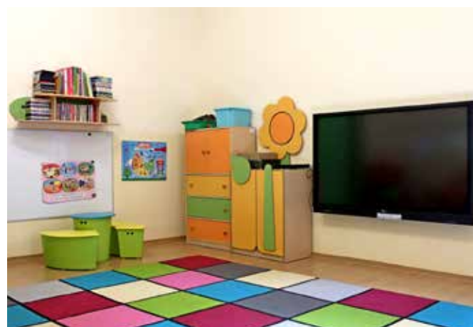
Przedszkole w Goeszowie