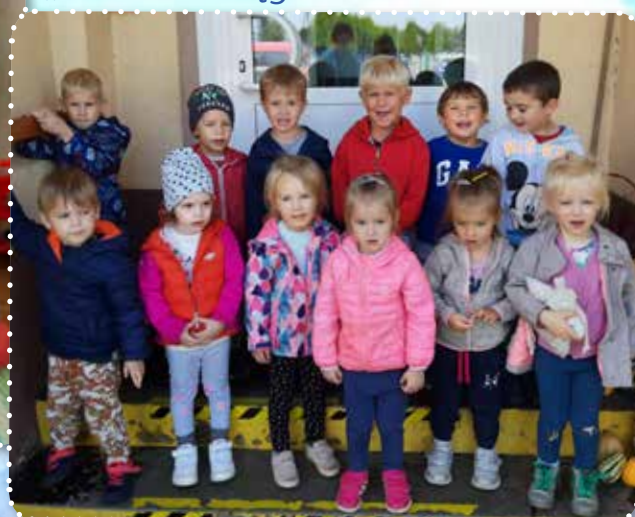
„Misie” z Dzięgielowa