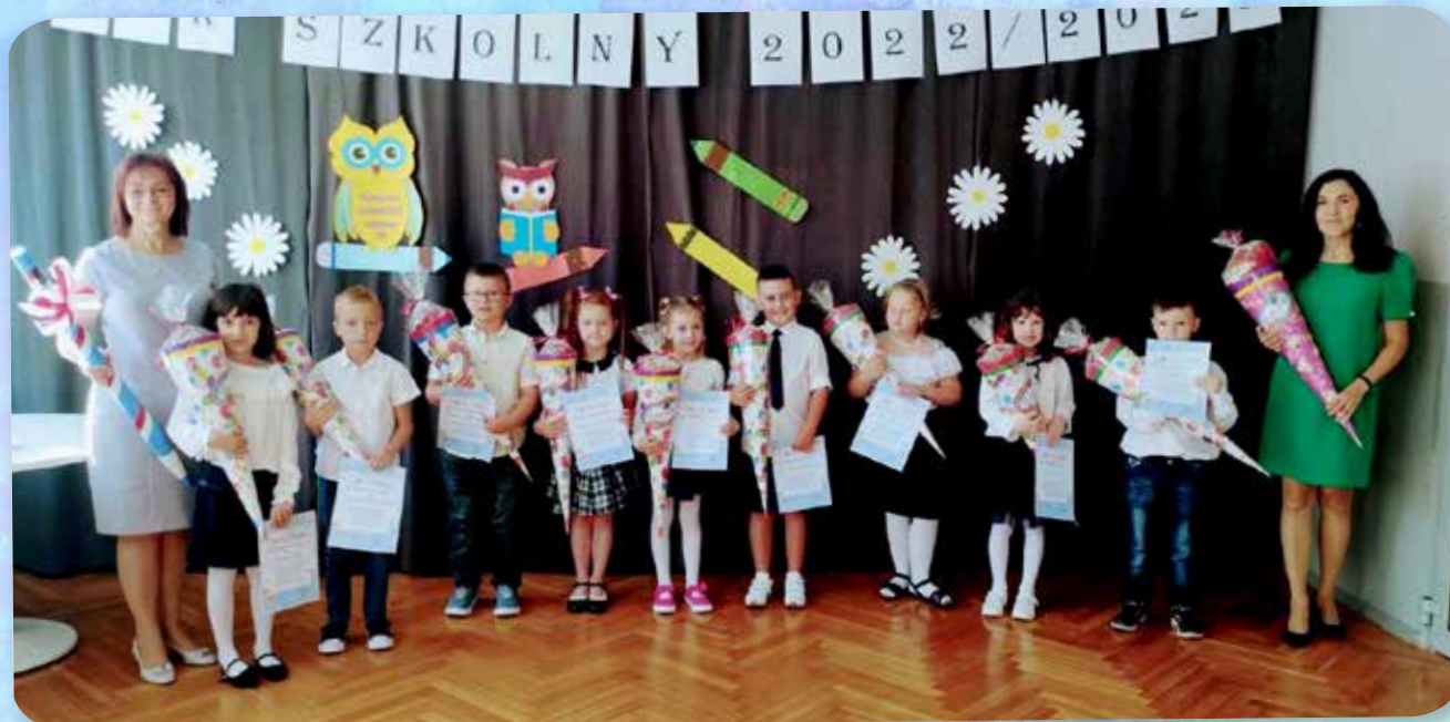
SP z Dziępielowa