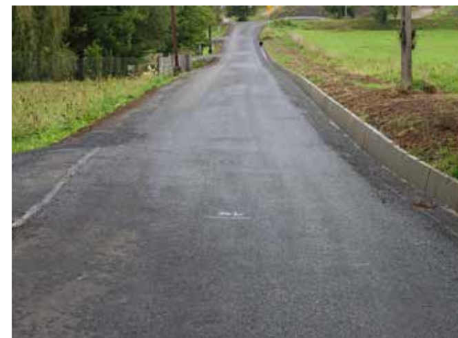
Puńców, ul. Graniczna

Wolności w Goleszowie. Dwie pierwsze zostały zmodernizowane przez Gminę Goleszów, a ostatnie – przez Powiat Cieszyński. Jeśli chodzi o poprawę stanu dróg, Gmina Goleszów nie zwalnia tempa i realizuje następne przedsięwzięcia: remont ul. Stromej w Goleszowie, ul. Skotnia w Bażanowicach i ul. ks. Kulisza w Dzięgielowie.