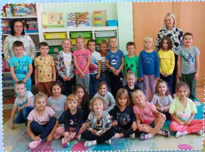
„Pszczółki” z Cisownicy