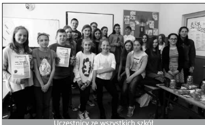
Uczestnicy ze wszystkich szkół