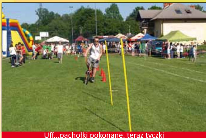
Uff...pachołki pokonane, teraz tyczki