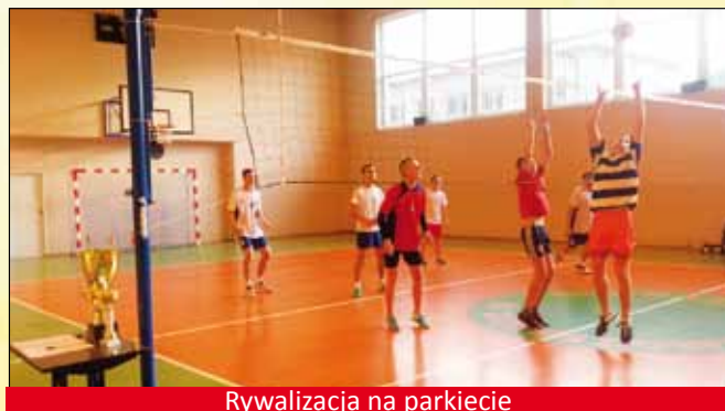
Rywalizacja na parkiecie

Gimnazjum SP2 Cieszyń - Gimnazjum Kończyce Wielkie 1:2