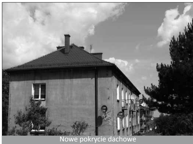
Nowe pokrycie dachowe

3. Rozpoczęto 1 etap rewitalizacji osiedla bloków komunalnych w Cisownicy - zakończono wymianę pokrycia dachowego na jednym z budynków i przemurowanie kominów ponad dachem na dwóch obiektach - docelowo do końca października wymiana pokrycia dachowego powinna być zakończona na wszystkich 7 budynkach. Przemurowanie kominów łącznie na 3 budynkach (na pozostałych zostały przemurowane wcześniej).