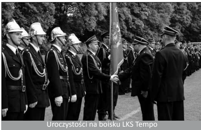
Uroczystości na boisku LKS Tempo