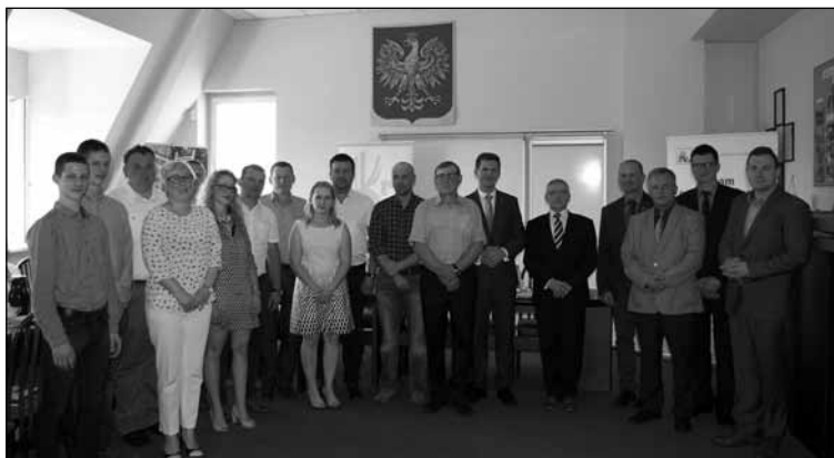
Nagrodzeni w konkursie

inwentarskich i gospodarczych, w tym schodów i używanych drabin oraz instalacji i urządzeń elektrycznych; wyposażenie maszyn w osłony ruchomych części, podpory i inne zabezpieczenia przed wypadkami; stan techniczny maszyn i urządzeń stosowanych w gospodarstwie; warunki obsługi i bytowania zwierząt gospodarskich; stosowanie i stan oraz jakość środków ochrony osobistej, a także rozwiązania organizacyjne, technologiczne i techniczne wpływające na bezpieczeństwo osób pracujących i przebywających w gospodarstwie rolnym.