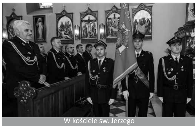
W kościele św. Jerzego

Całość rozpoczęła się o godzinie 13.00 koncertem orkiestry dętej. Następnie wszyscy strażacy oraz zaproszeni goście udali się do kościoła św. Jerzego, gdzie odbyła się ekumeniczna msza święta. Po tej części uroczystości na