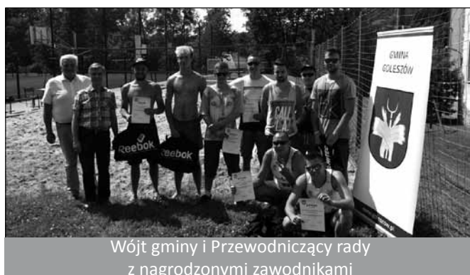
Wójt gminy i Przewodniczący rady z nagrodzonymi zawodnikami