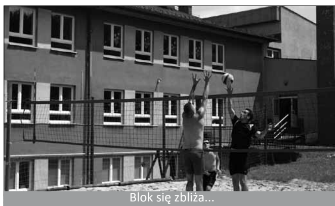
Blok się zbliża...