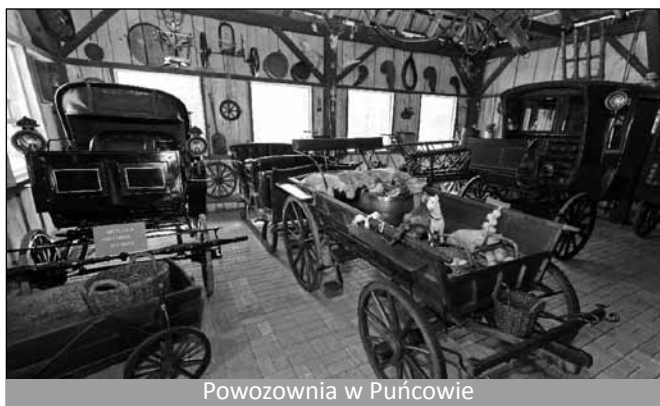
Powozownia w Puńcowie

Dlatego, mając też na uwadze jakże trafne powiedzenie: „Cudze chwalicie, swego nie znacie”, poniżej pierwszych 5 punktów z listy, całkowicie subiektywnej, dziesięciu miejsc w powiecie cieszyńskim, które trzeba znać (druga część w kolejnym numerze)!