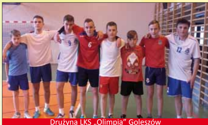
Drużyna LKS „Olimpia” Goleiszów