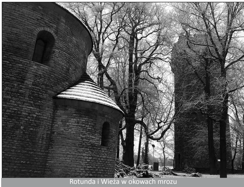
Rotunda i Wieża w okowach mrozu

1. Wzgórze Zamkowe – kolebka i wizytówka dzisiejszego Cieszyna oferuje wiele atrakcji. Wchodząc na nie mijamy