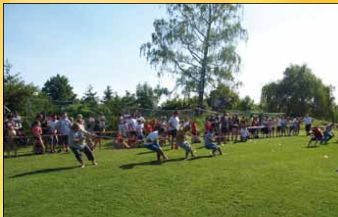
Przeciąganie liny - liczy się nie tylko siła, ale i technika