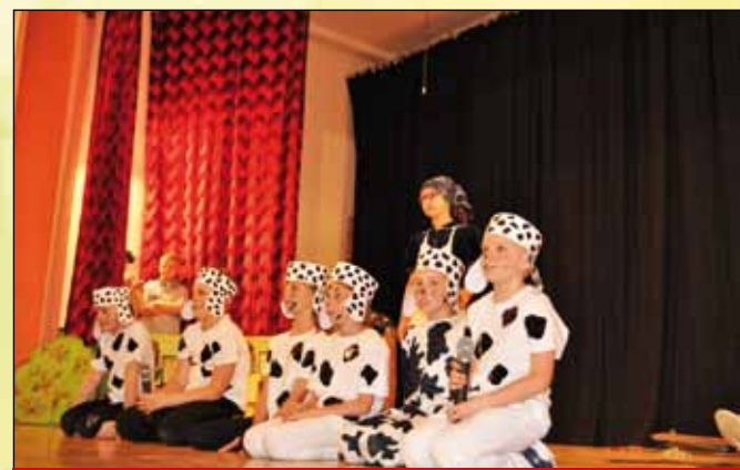
W trakcie występu