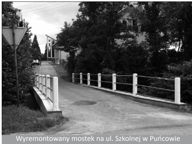
Wyremontowany mostek na ul. Szkolnej w Puńcowie

10. Przepust na ul. Spacerowej w Puńcowie, mostek na ul.