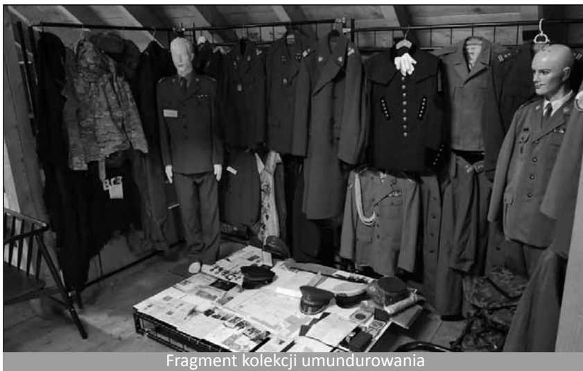
Fragment kolekcji umundurowania