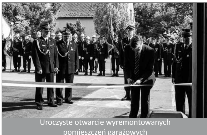
Uroczyste otwarcie wyremontowanych pomieszczeń garażowych