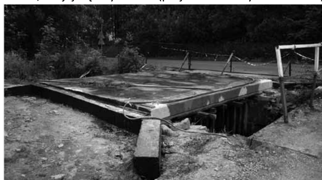
Most w trakcie budowy