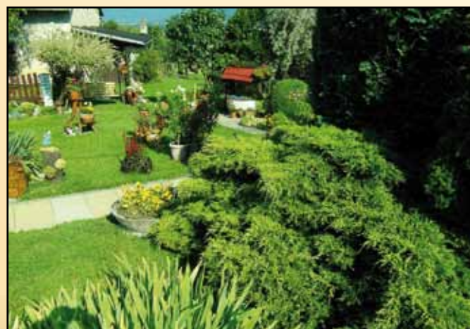
Wanda i Paweł Żmija - miejsce VI