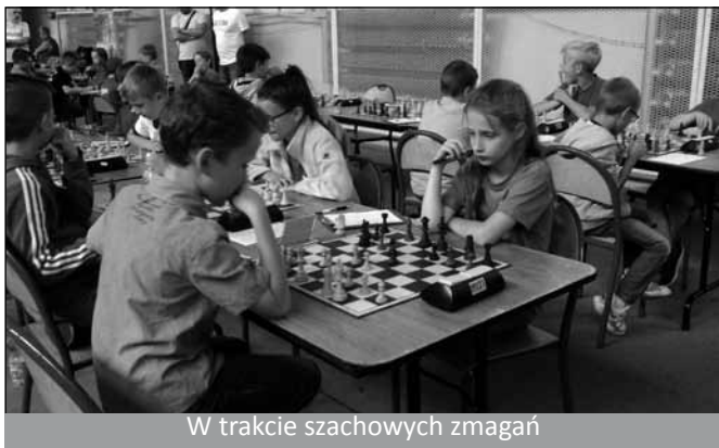
W trakcie szachowych zmagañ