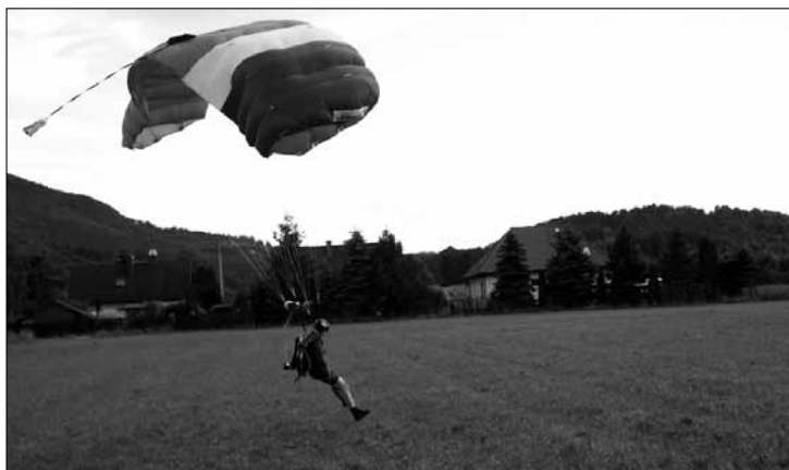
Pokaz skoków spadochronowych