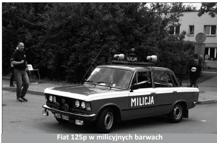
Fiat 125p w milicyjnych barwach

W dniach 14-15 lipca odbył się IV Rajd Retro PRL-u. Rozpoczął się w piątkowe popołudnie w Wiśle. W sobotę prawie 30 zabytkowych pojazdów przyjechało do