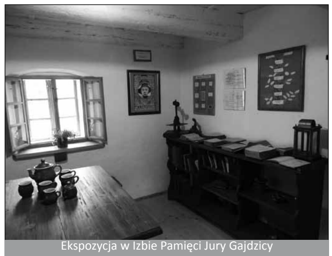
Ekspozycja w Izbie Pamięci Jury Gajdzicy

Izba Pamięci Jury Gajdzicy – to przesiąknięte historią miejsce zostało otwarte w 170. Rocznice śmierci Jury Gajdzicy (rok 2010), twórcy pierwszego polskiego ekslibrisu chłopskiego i autora chłopskich pamiętników, które są nieocenionym źródłem wiedzy o życiu mieszkańców XVIII wiecznej wsi. W „gajdzicowce” obejrzeć można ekslibrisy, książki opowiadające o historii Cisownicy i regionu, drzewo genealogiczne Gajdziców czy napis własnoręcznie wryty przez Jurę Gajdzicę. Adres: Cisownica, ul Ustrońska 200