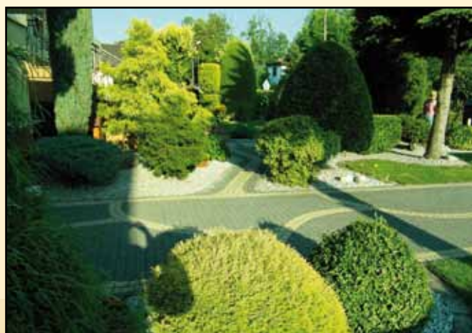
Ryszard Nytra - miejsce III