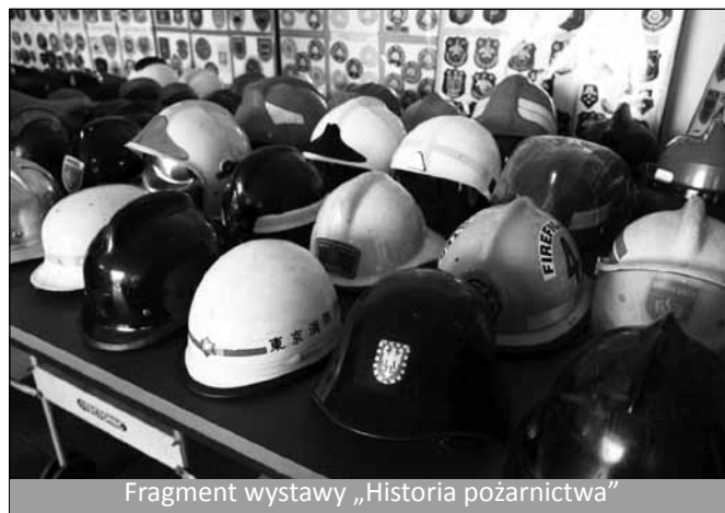
Fragment wystawy „Historia pożarnictwa”

Oprócz listów gratulacyjnych i życzeń przekazanych od wszystkich uczestników uroczystości, nasza jednostka dostała od wójta Krzysztofa Glajcara jubileuszowy prezent - okolicznościowy czek na kwotę 1.000,00 zł, na zakup sprzętu strażackiego.