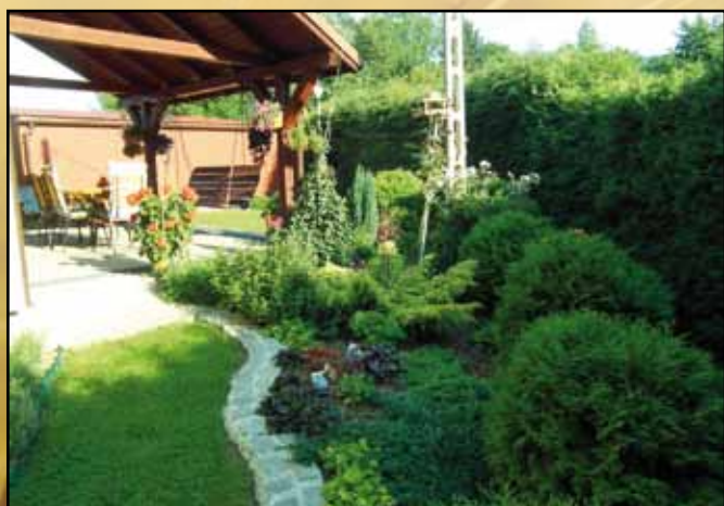
Jolanta Olek - miejsce IV