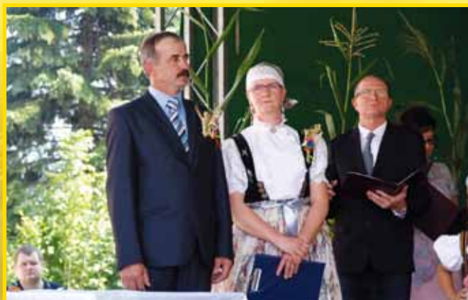
Gospodarze dożynek już na scenie