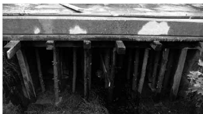
Most w trakcie budowy