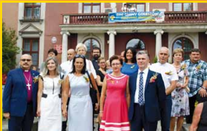
Przedstawiciele gminy wraz z zaproszonymi gośćmi