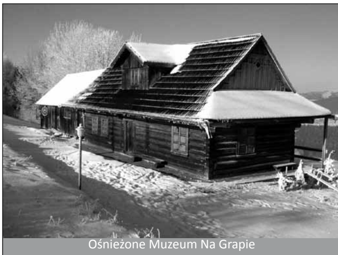
Ośnieżone Muzeum Na Grapie

Muzeum Na Grapie w Jaworzynce – działające od 1993 roku Muzeum składa się z Kurnej Chaty (z 1920 r.), stodoły oraz kuźni. Na jego terenie znajdziemy zarówno dawne narzędzia, stroje ludowe jak i prace miejscowych twórców ludowych i rzemieślników. W Muzeum prowadzone są również warsztaty z zakresu wyrobów ze słomy czy starodawnej kuchni. Adres: 43 – 476 Jaworzynka 420