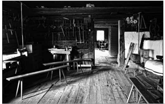
Wnętrze Chaty Kawuloka