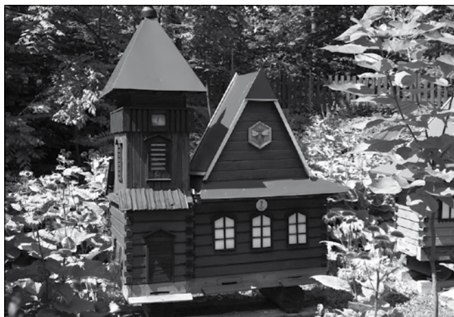
Jeden z uli

W sobotę (29.7) na terenie Pszczelego Miasteczka w Dzięgielowie odbył się kolejny Dzień Miodu. Jednak w tym roku Święto to miało szczególny, bardziej wzruszający i refleksyjny charakter – po raz pierwszy zabra-