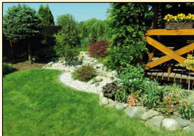
Izabela Chmiel - miejsce I ex aequo