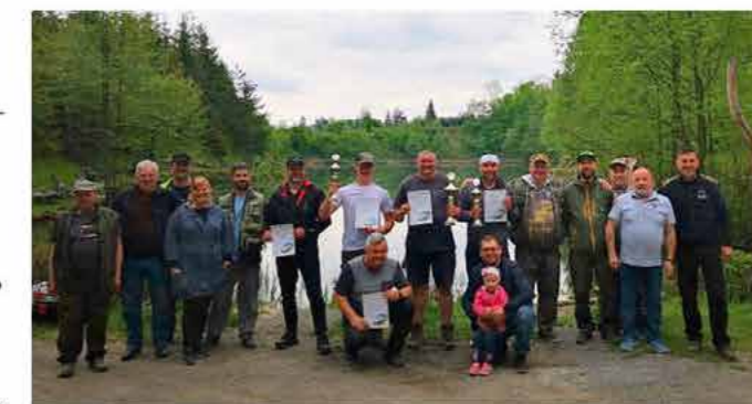
Zawody wędkarskie nad Tonem