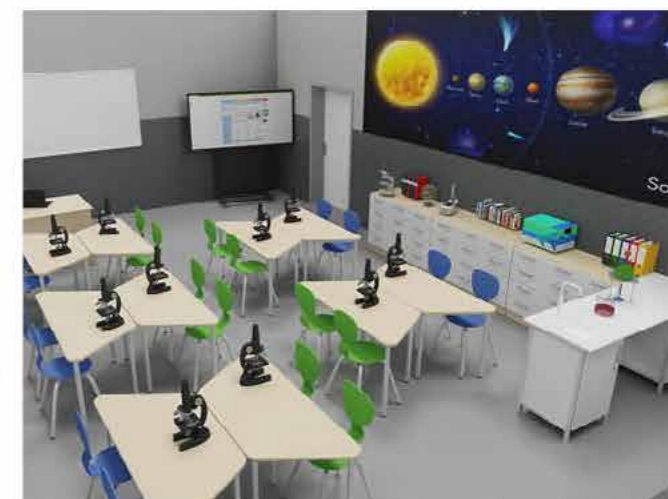
Wizualizacja Zielonej Pracowni