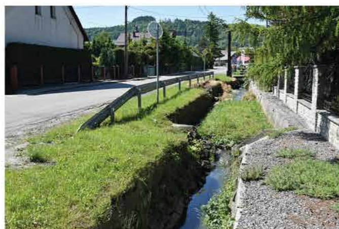
Oberna kanalizacja deszczowa na ul. Wolności

Wójt gminy Goleszów Sylwia Cieślak podpisała umowę z władzami powiatu cichyńskiego na stworzenie dokumentacji technicznej przebudowy istniejącej kanalizacji deszczowej na ulicy Wolności w Goleszowie. W zakres prac projektowych wchodzi m.in. przebudowa około półkilometrowego odcinka odbierającego wody opadowe z drogi do kanału, wraz z jego częściowym zarurowaniem oraz utwardzeniem pozostałej części.