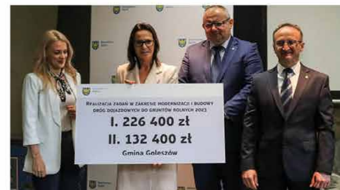
Czek na drogi dojazdowe do gruntów rolnych

Pozyskana przez gminę Goleiszów kwota pozwoli zrealizować remont ul. Rolniczej w Puńcowie na odcinku ponad 331 m oraz ul. Morawiny w Kisielowie na długości 566 m.