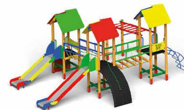
Wizualizacja placu zabaw

Środki na realizację inwestycji pochodzą z budżetu Gminy Goleszów oraz funduszu sołectkiego.