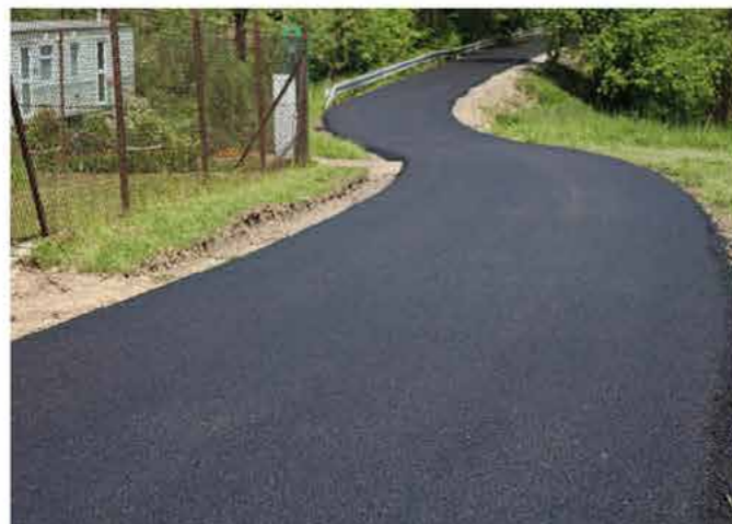
Ul. Malownicza po remoncie