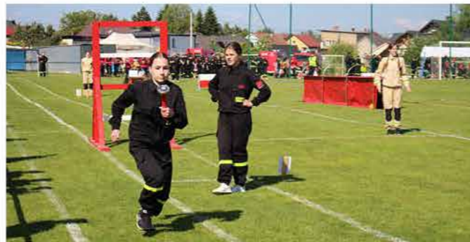
Zawody MDP w Dębowcu