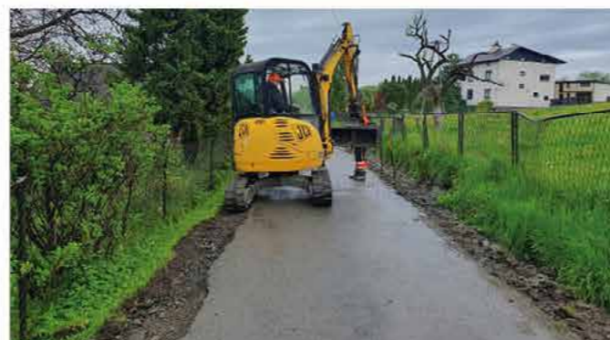
Ul. Ogrodowa w trakcie remontu

Niedługo zakończy się remont ulicy Ogrodowej w Kozakowicach Górnych. Prace mają na celu poprawę jakości i bezpieczeństwa naszej lokalnej infrastruktury drogowej. Zadanie inwestycyjne obejmuje różne etapy, w tym oczyszczanie przepustów i rowów oraz utwardzenie poboczy. Dzięki pracom w tej miejscowości zostanie oddanych do użytku około 800 m 2 nowej nawierzchni. Mieszkańcom oraz osobom odwiedzającym Kozakowice Górne w czasie remontu dziękujemy za cierpliwość i wyrozumiałość oraz stosowanie się do tymczasowego oznaczenia drogowego.