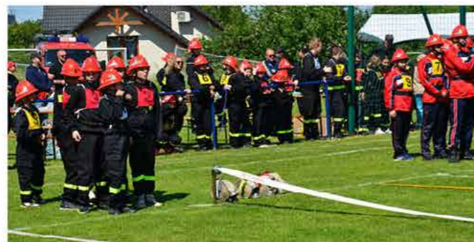
Zawody MDP w Dębowcu

Zawody zakończyły się uroczystym wręczeniem dyplomów i pucharów ufundowanych przez wójta gminy Goleszów Sylwią Cieślak.