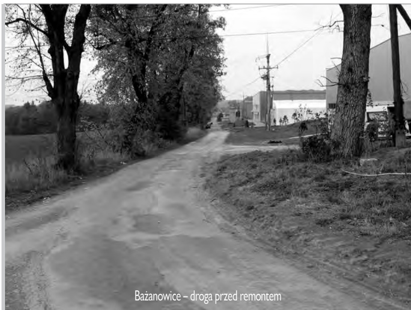
Bażanowice – droga przed remontem

Inspektor ds. projektów unijnych Urzędu Gminy Golezów Zbigniew Kohut