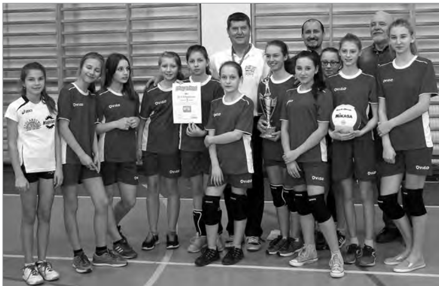
Zwycięska drużyna z Dzięgielowa

W tegorocznej edycji zmierzyły się 4 zespoły składające się wyłącznie z dziewczyn, które reprezentowały: Szkołę Podstawową nr 2 z Cieszyna, Szkołę Podstawową nr 6 z Cieszyna; Szkołę Podstawową Towarzystwa Ewangelickiego z Cieszyna i Szko-