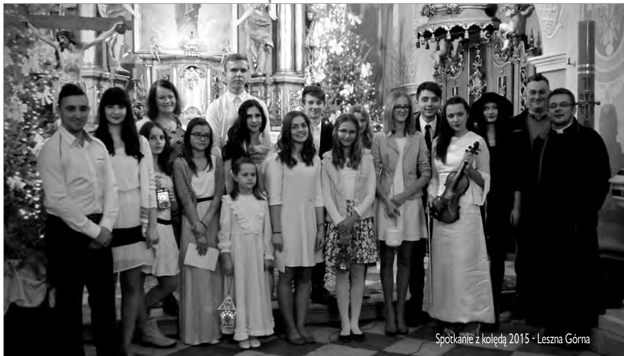
Spotkanie z kolędą 2015 - Leszna Górna

Organizator: Parafia Ewangelicko- Augsburgska w Dzięgielowie