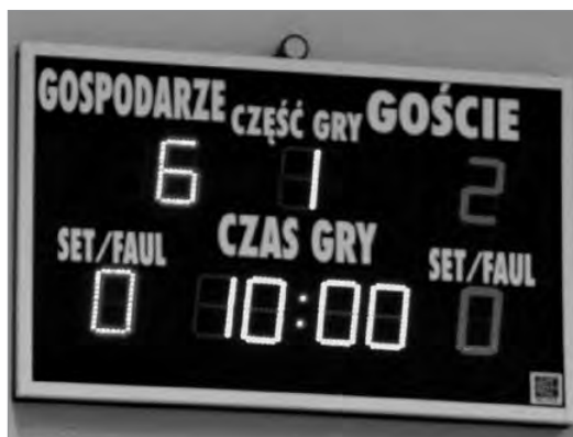
Tablica zakupiona w ramach projektu