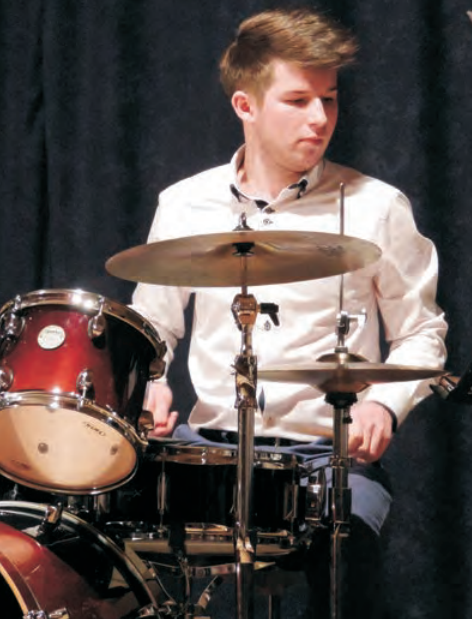
Czytaj str. 10