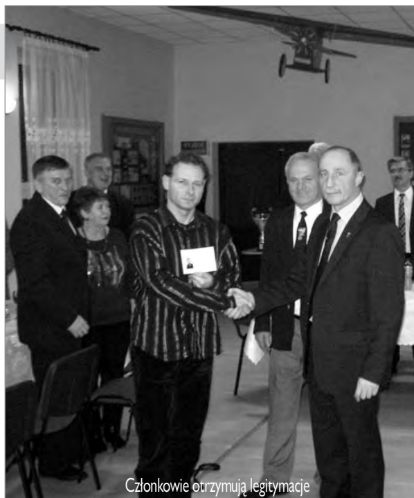
Członkowie otrzymują legitymacje