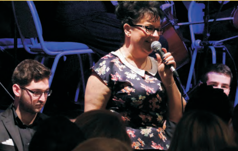
Czytaj str. 14