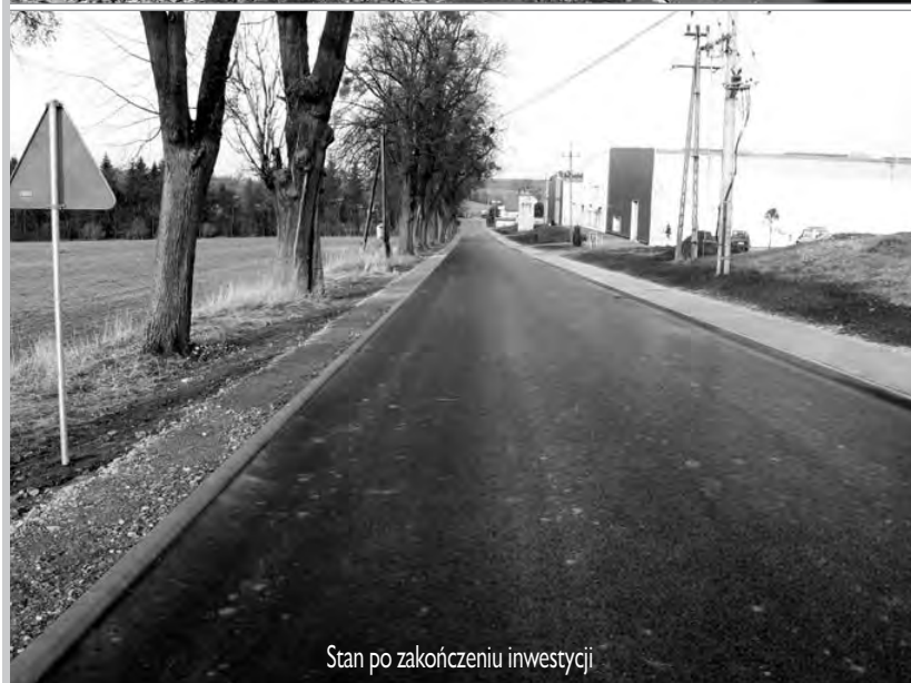
Stan po zakończeniu inwestycji