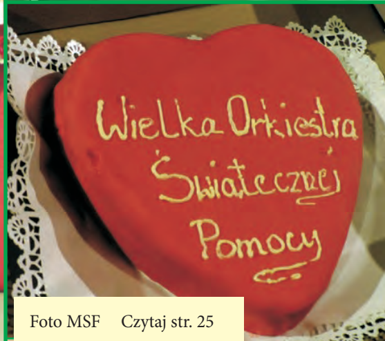
Czytaj str. 25