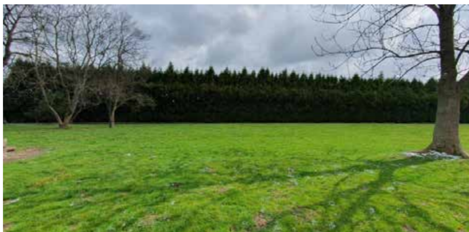
Miejsce, w którym powstanie „Ogród ekobadaczy”

„Ogród ekobadaczy” będzie służyć nie tylko uczniom, ale także społeczności Dziegielowa, która aktywnie uczestniczy w życiu szkoły, tematyka związana z ekologią cieszy się bowiem