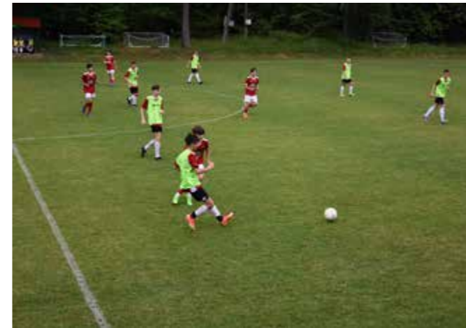
„Duża Piłkarska Kadra CzeKa” w Puńcowie

W środę, 21 czerwca na obiektach LKS Tempo został rozegrany turniej „Duża Piłkarska Kadra CzeKa”. W rywalizacji wzięło udział siedem drużyn podzielonych na dwie grupy: LKS Bestwina, UKS Dwójka Kozy, LKS Pasjonat Dankowice, UKS Orzeł Moszczenica, MGLKS Liswarta Krzepice, LKS Ciężkowanika Jaworzno i LKS Olza Pogwizdów. Ponad stu zawodników w wieku ok. 15 lat grało na puńcowskich boiskach. Po kilkugodzinnej rywalizacji najlepszą drużyną okazał się UKS Orzeł Moszczenica, drugie miejsce wywalczył LKS Bestwina, trzecie LKS Pasjonat Dankowice, a czwarte miejsce przypadło LKS Olza Pogwizdów. Turniej był jednocześnie Mistrzostwami Śląska Ludowych Zespołów Sportowych, a najlepsi piłkarze zmierzą się w Mistrzostwach Polski.