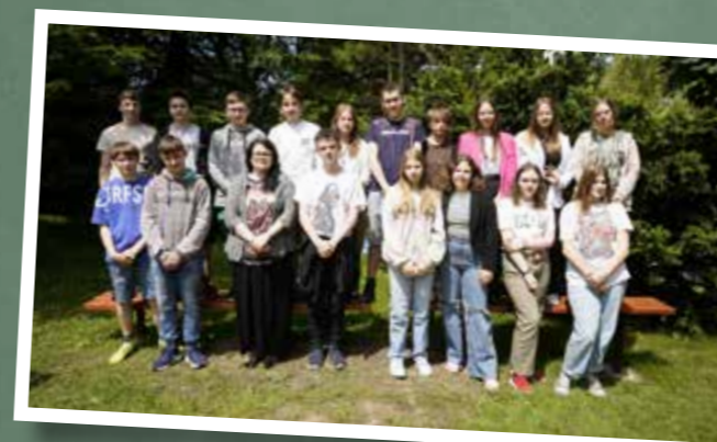
klasa 8 a – ZSP Cisownica