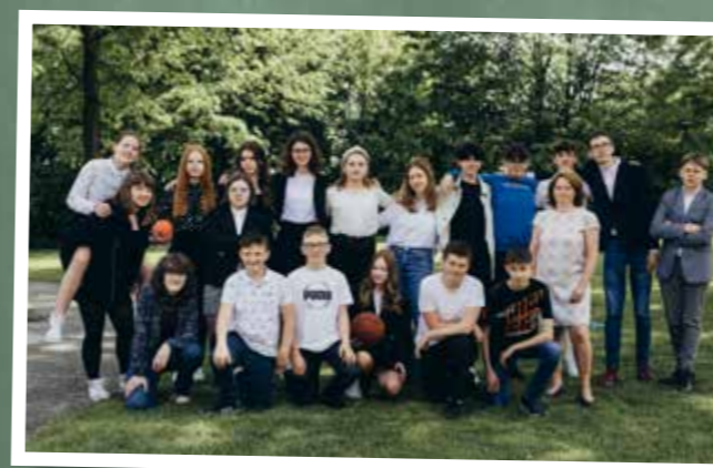
klasa 8a – SP Goleszów