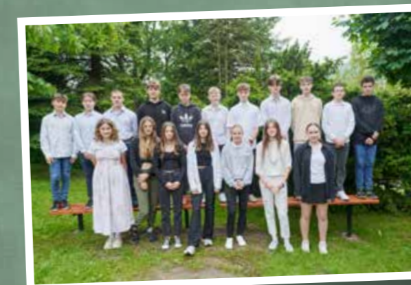
klasa 8 b – ZSP Cisownica