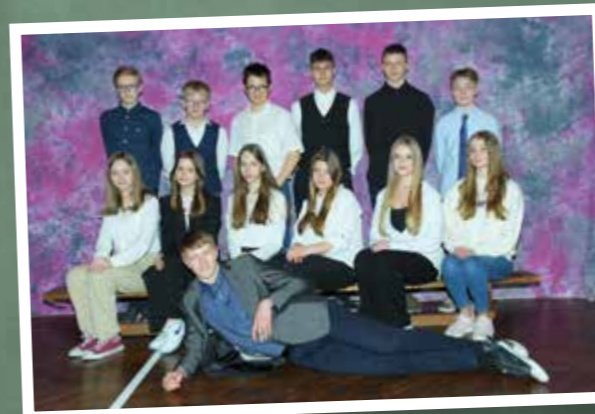
8 klasa – SP Bązanowice