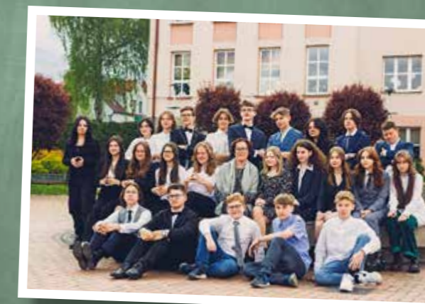
klasa 8b – SP Goleszów