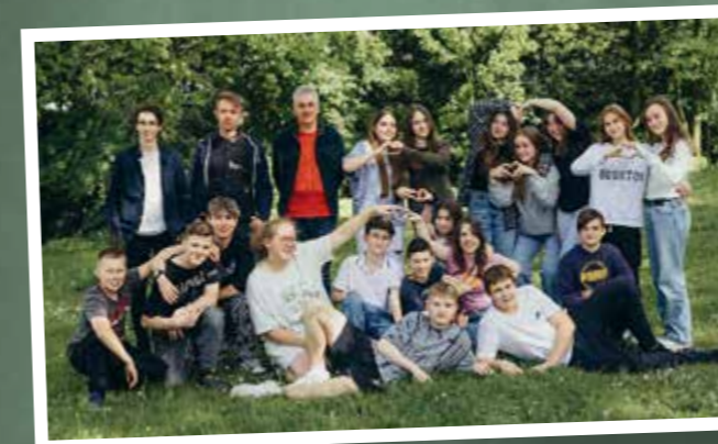
klasa 8e – SP Goleszów