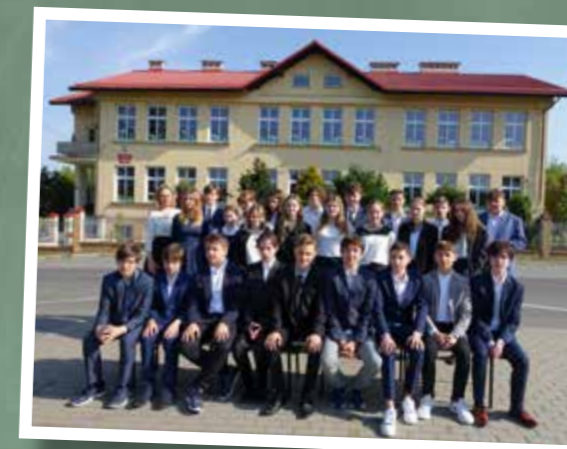
klasa 8 – SP Dziegiełków