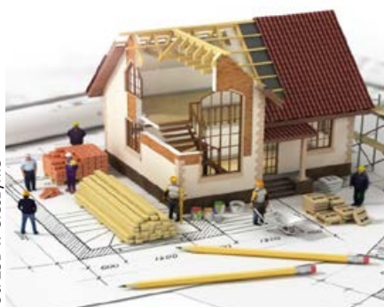
fol. ZSB w Cieszynie