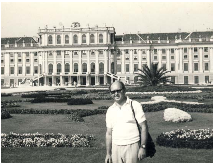
W Wiedniu, 1980 r.

Z pewnością tak, a historia samego Goleszowa jak i całej gminy na pewno zasługuje na pełne opracowanie – może warto byłoby spróbować napisać monografię