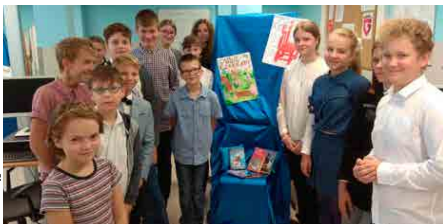
fol. SP Dzięgielów

„Książka i możliwość czytania, to jeden z największych cudów ludzkiej cywilizacji”