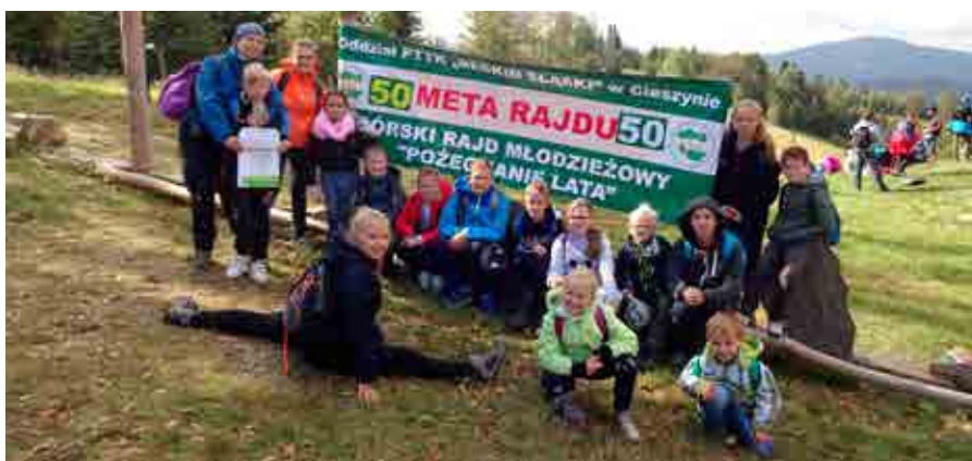
fol. SP Bażanowice