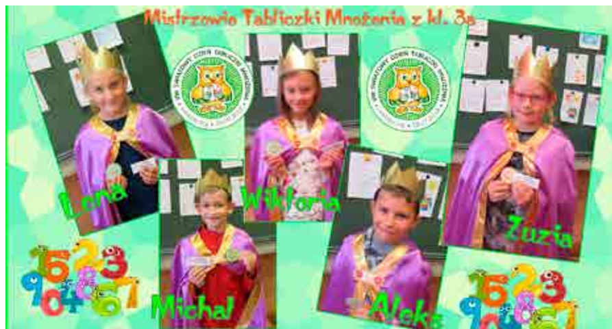
fol. SP Goleiszów

Zwycięzcy otrzymali pamiątkowe medale i certyfikaty udziału